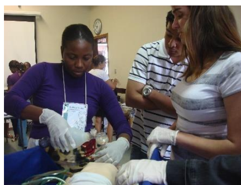
人間的出産の研修