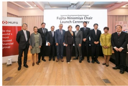
主要関係者による記念撮影

「MUFGバンク＝ブラジル進出100周年＝藤田・二宮USP講座に寄付＝日伯関係者がJHで記念式典」