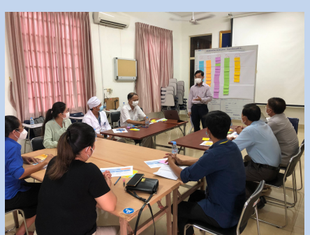
FGD, Kampong Cham Provincial Hospital / 25th April