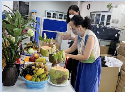
Khmer New Year Celebration at HRDD / 14th to 16th April