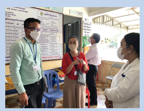
Visiting Ampil Health Center, Kampong Cham Province /