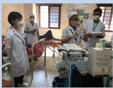
Nursing Skill Assessment, Kampong Cham Provincial Hospital / 26th April