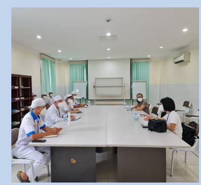
Nursing Skills Assessment, Calmette Hospital / 7th April