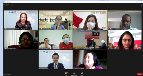
3rd CPD Online Workshop via Zoom Meeting