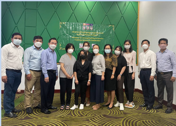
All the participants of the 2nd workshop