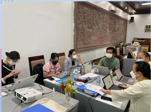
Activities during the group discussions

លទ្ធផលនៃសេចក្តីប្រាណនេះនឹងត្រូវធ្វើជាបទបង្ហាញទៅកាន់គណៈកម្មការគ្រប់គ្រងរបស់គម្រោងនៅក្នុងសិក្ខាសាលាលើកទី ៣ នាពេលខាងមុខ ដែលជាវគ្គបញ្ចប់សម្រាប់ការអភិវឌ្ឍគោលការណ៍ណែនាំថ្នាក់ជាតិ នៅខែតុលា ឆ្នាំ 2022។