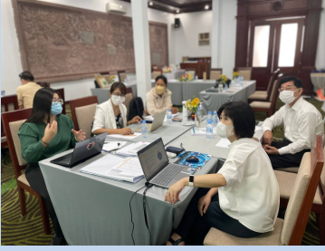
Activities during the group discussions