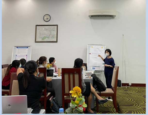
Activities during the group discussions