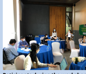
Participants during the workshop