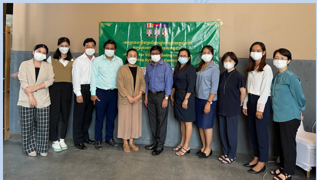
All the participants of the 4th workshop

បន្ទាប់ពីសិក្ខាសាលានេះចប់ សមាជិកក្រុមការងារបច្ចេកទេស នឹងបន្តធ្វើការកែសម្រួលទៅ លើគោលការណ៍ណែនាំថ្នាក់ជាតិជាភាសាអង់គ្លេស និងភាសាខ្មែរសម្រាប់ដំណើរការអនុម័តនៅក្រសួងសុខាភិបាល ។