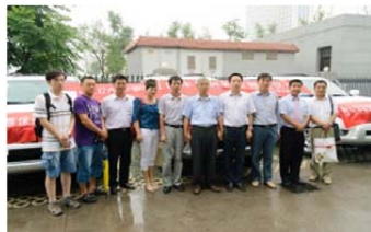
与各项目实施地的工作人员合影