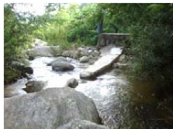
修复后的取水堤坝

计划在寨沟村建设驯化饲养网笼，为今后的野化放飞做准备，同时还计划开展朱鹮的生境建设。下一步，将在寨沟村更大的范围内建设水渠网络，使更多的水田恢复耕种，最终完善朱鹮的生境。目前，林业局和当地的村庄正在商榷拟定相关计划。