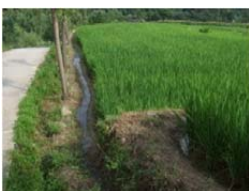
水渠修复后重新耕种的稻田