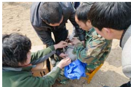
正在为训练个体安装GPS发射器

董寨自然保护区计划在今年秋季实施放飞工作。因此，下一阶段将针对这些个体，在飞翔能力、自主觅食能力、成群夜宿的群体生活能力等方面加强野化训练。今后，项目在与董寨自然保护区的合作过程中，将继续跟踪训练效果，并开展放飞前的宣教工作。