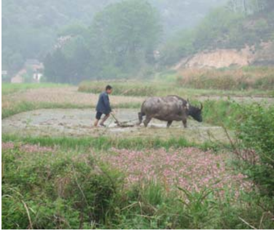
在董寨自然保护区内, 还能看到农民使用耕牛在水田犁地的情景