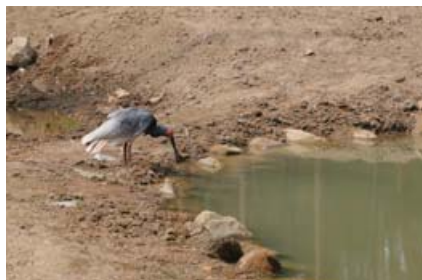
大网笼内佩戴脚环的朱鹮