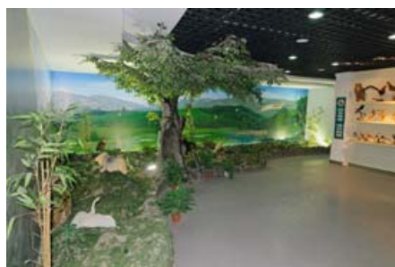
介绍朱鹮与洋县自然环境的展区