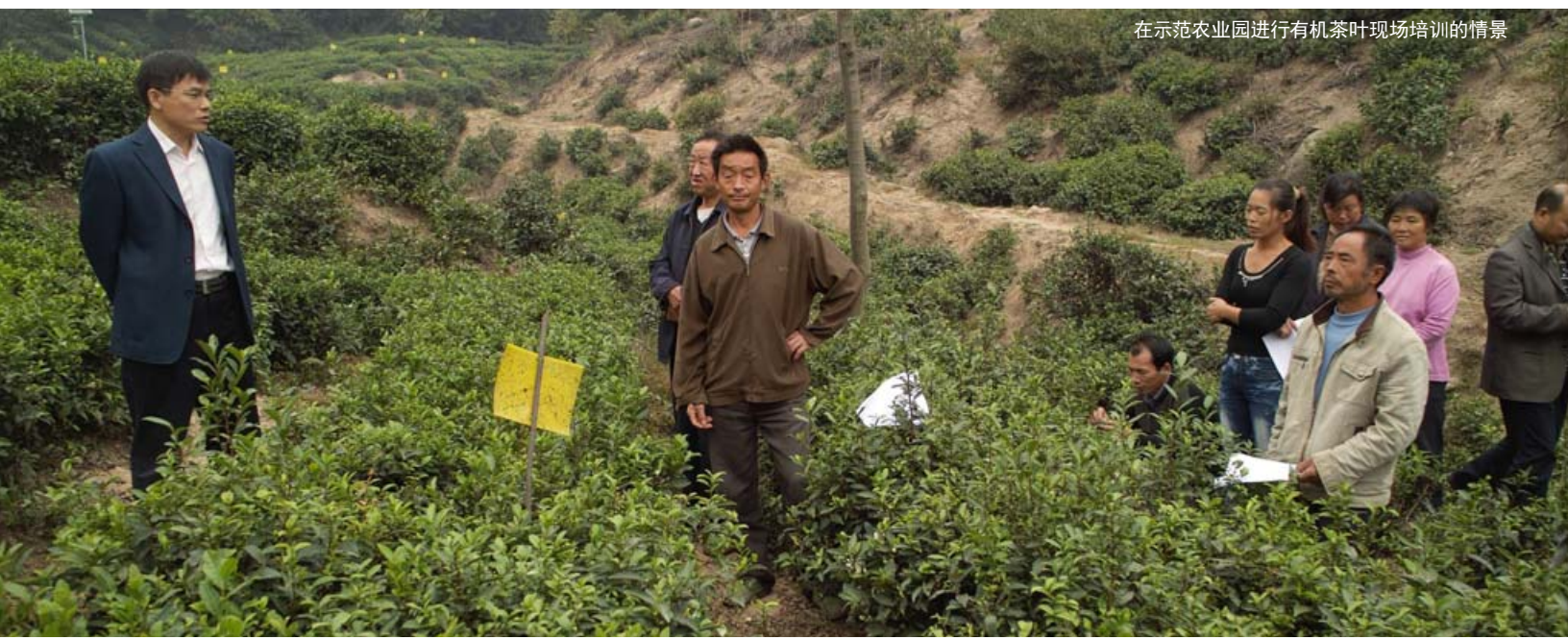
在示范农业园进行有机茶叶现场培训的情景