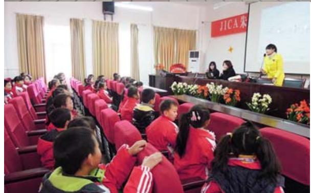
上：审查作品的情形 / 中：获奖的学生们 / 下：颁奖仪式结束后举办的朱鹮科普知识讲座