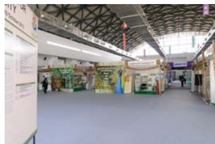
互动展示会场内各具特色的展台