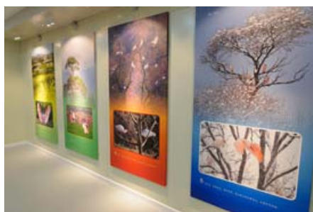
介绍四季里朱鹮美丽身影的展板