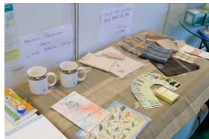
跟老挝及巴西等地的项目一同展示的朱鹮项目宣传纪念品和环境教育教材