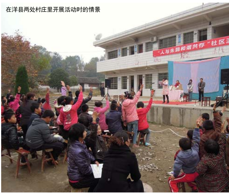
在洋县两处村庄里开展活动时的情景