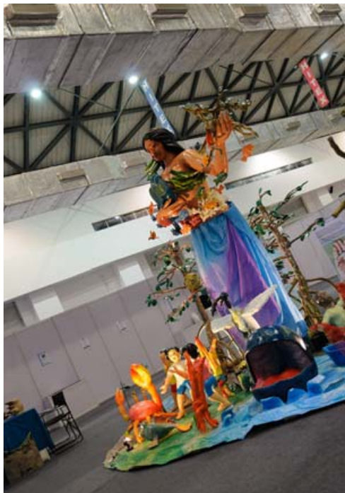
会场内装饰的带有印度特色的色彩鲜艳的造型