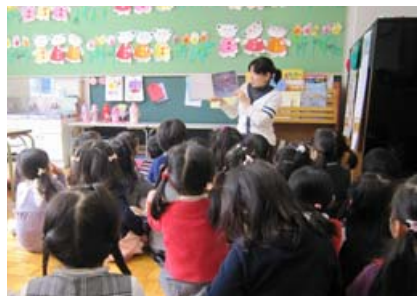
正在朗读授课的小野老师和认真听讲的孩子们