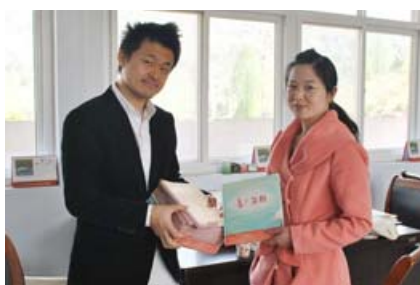
向董桥小学校长赠送图画书

正在为朱鹮的野化放飞做准备的河南省董寨，除在大网笼内进行野化放飞训练及相关放飞准备工作之外，还在提高当地居民对朱鹮的关注度、提高人们的认识方面，积极开展知识推广普及和环境教育活动。此次利用印制完成的《看! 朱鹮》和《朱鹮卡卡》，在董寨自然保护区内的两个小学进行了示范教学。