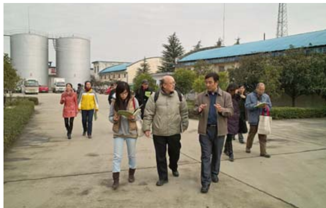
参观有机食品企业（双亚粮油公司）