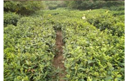
抽取沼气污泥的情景与抽渣车、有机茶园