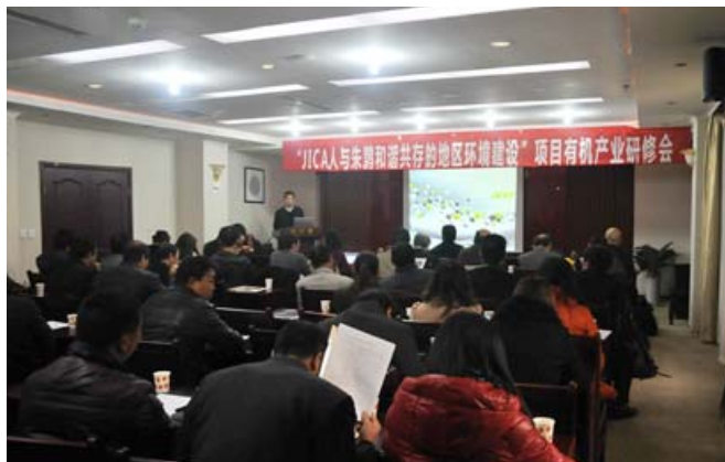
洋县人民政府曹副县长致辞