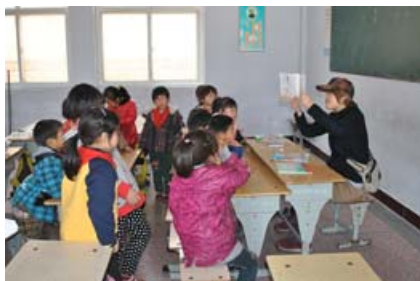
小池女士在高寨小学朗读授课