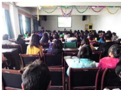
陕西师范大学《朱鹮卡卡》讲读课上