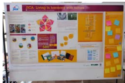
介绍JICA活动内容的宣传海报上也有朱鹮的身影