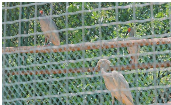
从日本返还的朱鹮（后排）产下的幼鸟（前排）

董寨自然保护区饲养的朱鹮是由北京动物园转来的4只朱鹮和2007年从日本返还的13只朱鹮繁育而成的。这些朱鹮每年都产下许多雏鸟，有些也是自然繁殖配对的。