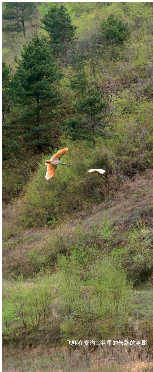
飞翔在寨沟山谷里的朱鹮的身影

寨沟村还是首次迎来城市里来的孩子们，村民们虽然暂时有些慌乱，但遵照委托按时提供了餐食，也有人购买了木耳等农产品。总之，通过这次活动，让村民们感受到了与城市人们之