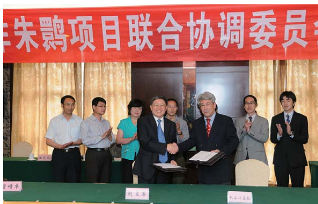
两国代表签署中期评估团提交的评估报告

评估团成员一行还参加了5月30日在董寨自然保护区举行的朱鹮野化训练大网笼竣工庆典。