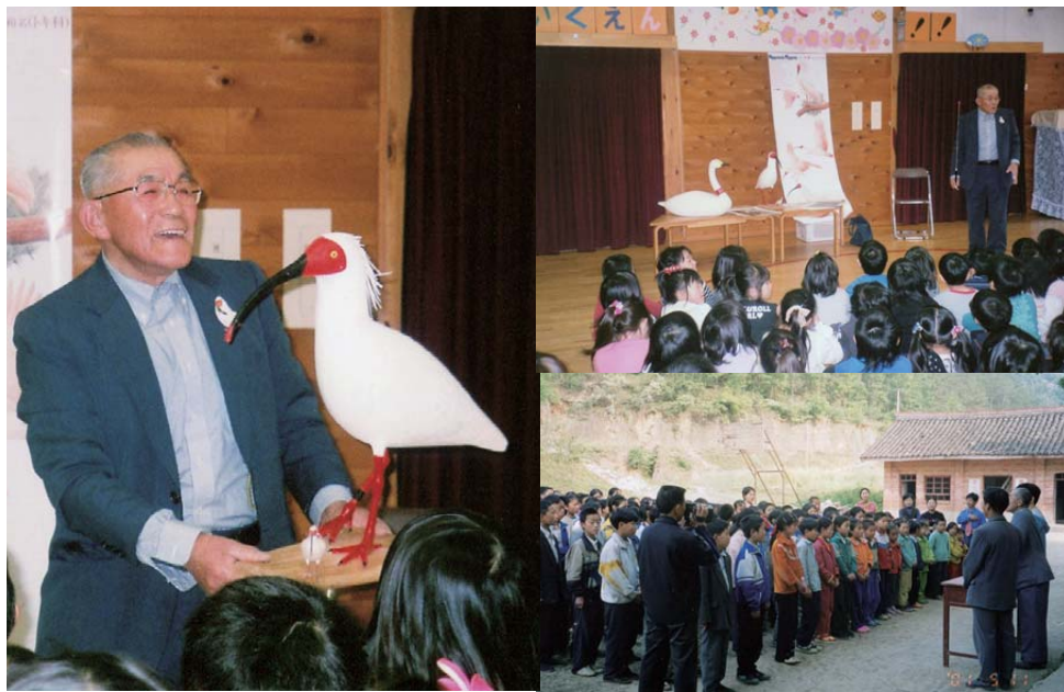
左·右上: 2013年3月, 作者在石川县羽咋市“朱鹮”幼儿园的讲演。