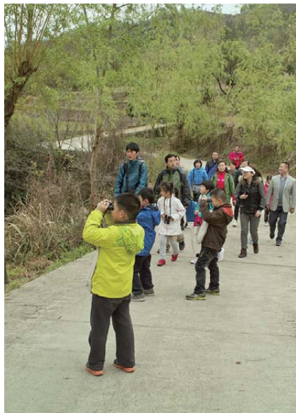
右上：参加亲子团生态体验的孩子们 / 右中：大家一起来扎稻草人 / 右下：在农户家吃午饭 左边：徒步走在寨沟山谷里，连带野外观鸟