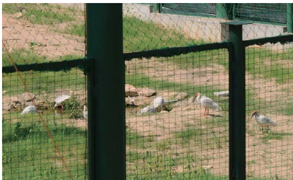
在野化训练大网笼内池塘中觅食的朱鹮

目前在野化训练大网笼中训练的朱鹮有34只。训练它们在网笼内栽植的树木上夜宿、在小溪或池水中觅食、盘旋且长时间飞翔等能力，放飞前的训练进展顺利。