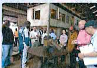
Visite d'entreprise de Soudure (avril 2015)