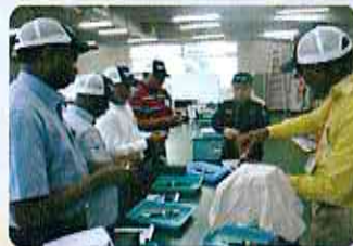
Formation des MFs au Japon (juin-juillet 2015)