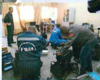
Formation Pratique pour MFs (avril-mai 2015)