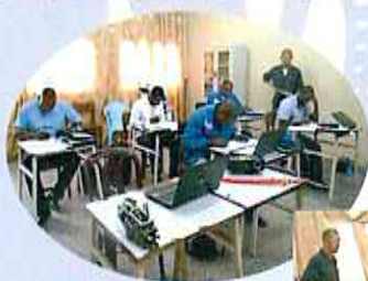
Formation théorique pour MFs (mars-mai 2015)

■ Après la formation des maîtres formateurs mentionnée ci-haut, nous nous sommes mis à nous préparer pour la FDF prévue pour novembre 2015.