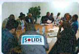
Activités par l'expert Japonais et SGT (mai- Juin 2015)

■ En plus des activités en RDC, nous mèneront une visite d'étude au Japon en septembre 2015 pour y apprendre la bonne pratique.