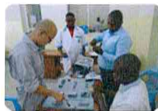
Activités par l'expert Japonais et MFs (mai-juillet 2015)

■ Le lancement de la formation est prévu pour le mois de septembre 2015.