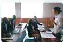
Activité par l'expert Japonais et SG Analyse des besoins (avril- mai 2015)

■ En juillet 2015, les résultats des activités du CGF pour le résultat-1 ont été présentés aux entreprises et aux syndicats, ils ont été admirés.