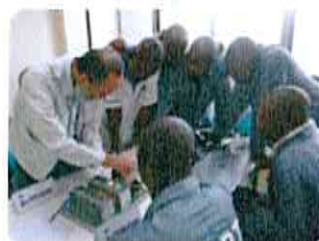
Formation pratique pour MFs (Juillet 2015)