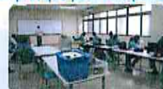
Formation théorique pour MFs (juillet 2015)