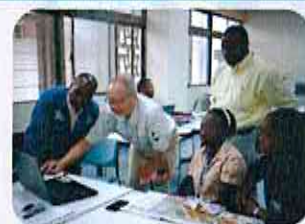
Activité par l'expert Japonais et GT CGF (Juin 2015)