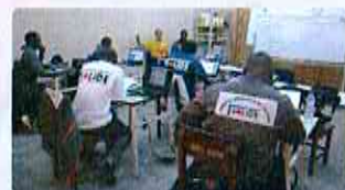
Préparation de la FDF (août.-oct. 2015)