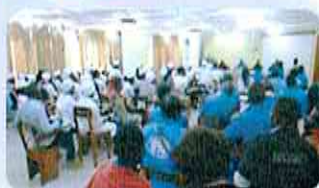
Séminaire sur l'entrepreneuriat (août 2015)