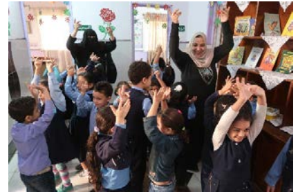
الرقص بسعادة مع الميسر

من الساعة 8 إلى الساعة 9: يتم تسجيل الحضور ويتناول الأطفال وجبة الإفطار في حديقة الحضانة.