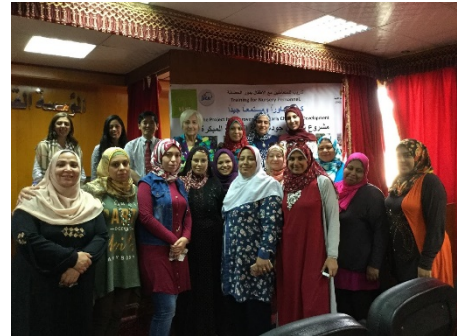
صورة مع مؤلفة احدى الكتب المصورة