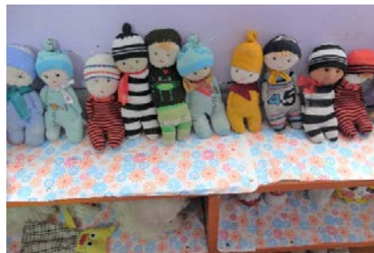
عرائس يدوية قام بعملها ميسرات الحضانة

يقوم الأطفال باختيار الركن الذي يريدون اللعب به بحرية تامة والإستمتاع به. ومن الأركان الأكثر رواجاً بين الأطفال "ركن البيت، ركن التلوين والرسم". ففي ركن البيت يستمتع الأطفال بلعب الأدوار المختلفة مثل دور "الأب، الأم، شيف بمطعم، كرافير.... الخ". مما يساعدهم على معرفة الأدوار البشرية وتنمية العديد من المهارات لديهم. أما عن ركن الرسم والتلوين: يسعد الأطفال بالرسم وتلوين الأشكال المختلفة مما يساعدهم على معرفة الأشكال والألوان وكيفية التفرقة بينهم.