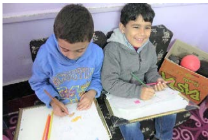
انه من الممتع الرسم والتلوين في ركن الرسم-

ركن الألعاب هو أن تقوم الميسرات بإعداد بعض الأركان الملائمة للأنشطة مثل ركن الحرف، ركن البيت... الخ. مما يساعد الأطفال على إختيار الأنشطة التي يريدون اللعب والإستمتاع بها. هذا النوع من أساليب العناية والتعليم يبين عافية الأطفال في إختيار نشاط ما طبقاً لإهتماماتهم. وسوف نقوم بتقديم مدى أهمية ممارسة الأطفال لهذه الأنشطة وقيمتها الفعالة بالحضانات النموذجية الأخرى التابعة للمشروع.