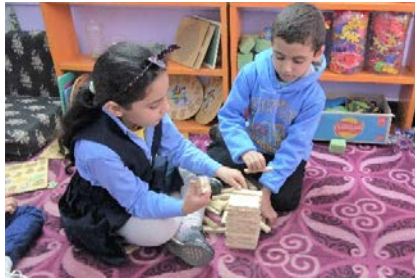
تحدي لبناء منزل كبير في ركن الحرف

من الساعة 1 وحتى الساعة 2: وقت اللعب بالأركان. حيث يقوم الأطفال باختيار النشاط المحبب لديهم من ضمن العديد من الأنشطة والإستمتاع به.