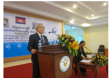
សិក្ខាសាលានៅសាលាជាតិពន្ធដារ