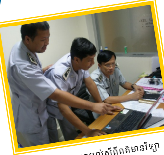
ការប្រឹក្សាយោបល់ស្តីពីព័ត៌មានវិទ្យា