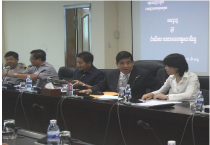
កិច្ចពិភាក្សាក្រោមវត្តមានរបស់ឯកឧត្តមអគ្គនាយក

គម្រោងនេះមានរយៈពេល១ឆ្នាំ ក្រោមកិច្ចខំប្រឹងប្រែងប្រកបដោយភាពជោគជ័យរបស់គណៈកម្មការសម្របសម្រួលគម្រោង