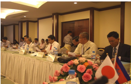
កិច្ចប្រជុំគណៈកម្មការសម្របសម្រួលគម្រោងលើកទី១ នៅសណ្ឋាគារភ្នំពេញ ថ្ងៃទី២ ខែសីហា ឆ្នាំ២០១២