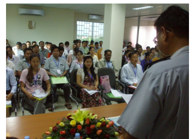
សិក្ខាសាលាស្តីពីសេវាអ្នកជាប់ពន្ធ នៅសាខាពន្ធដារខេត្តឫស្សីកែវ

២៧ កុម្ភៈ ដល់ ១ មិនា៖ សិក្ខាសាលាស្តីពី “សេវា អ្នកជាប់ពន្ធ ដោយប្រើប្រាស់ប្រព័ន្ធផ្សព្វផ្សាយ” នៅអគ្គនាយកដ្ឋានពន្ធដារ។ សមាជិកក្រុម ការងារនឹងអញ្ជើញចូលរួម។