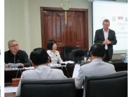
មន្ត្រីជាន់ខ្ពស់ ៦៣នាក់ បានចូលរួមសិក្ខាសាលានេះ