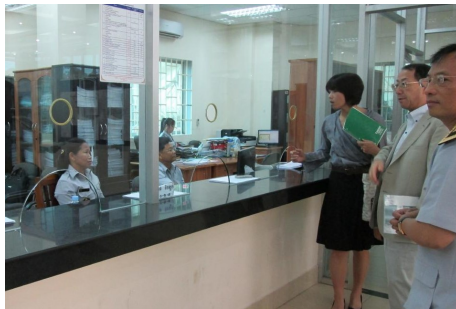
ការិយាល័យមានការរៀបចំបានល្អ (សាខាពន្ធដារខណ្ឌទួលគោក)

ព្រមទាំងបានចែករំលែកគំនិតស្តីពីការធ្វើឱ្យប្រសើរឡើងនូវ ដំណើរការចាត់ចែងលិខិតប្រកាស។ វប្បធម៌ការងារដែលត្រូវ បានស្នើឡើងបានប្រគល់ជូន អគ្គនាយក កាលពីខែ សីហា។