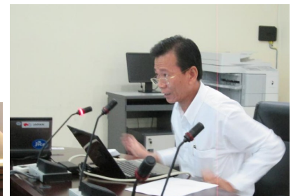
កិច្ចពិភាក្សានៅ អពជ