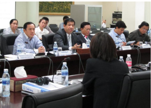
កិច្ចប្រជុំ JCC លើកទី៣ នៅសាលប្រជុំលេខ ៦១១