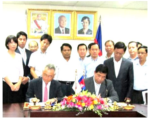
ឯកឧត្តម គង់ វិបុល អគ្គនាយក នៃអគ្គនាយកដ្ឋានពន្ធដារ និង លោក Izaki ប្រធានតំណាងជាន់ខ្ពស់ JICA ប្រចាំការិយាល័យនៅកម្ពុជា បានចុះហត្ថលេខាលើកំណត់ហេតុនៃកិច្ចពិភាក្សា។

អគ្គនាយក នៃអគ្គនាយកដ្ឋានពន្ធដារ និងប្រធានតំណាងជាន់ខ្ពស់របស់ JICA ប្រចាំការិយាល័យនៅកម្ពុជាបានព្រមព្រៀងពន្យារពេលដំណាក់កាលអនុវត្តគម្រោងនាពេលបច្ចុប្បន្នរយៈពេល១០ខែរហូតដល់ដំណាច់ខែ កក្កដា ឆ្នាំ២០១៥។ ពិធីចុះហត្ថលេខាបានធ្វើឡើងនៅ អពជ កាលពីខែមិថុនា។ ក្រុមការងារគម្រោងចាំបាច់ត្រូវបំពេញបញ្ចប់រាល់សកម្មភាពដែលបានគ្រោងទុកទាំងអស់ដោយរួមមានការបង្កើតនូវសកម្មភាពអនុវត្តល្អៗ (best practice)។ មន្ត្រីបំពេញការងារចាំបាច់ត្រូវបើកទូលាយគំនិតចំពោះបរិយាកាសការងារថ្មី។