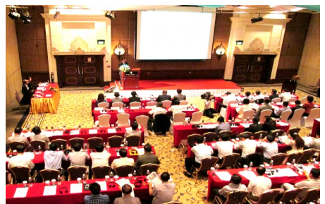
សិក្ខាសាលារៀបចំនៅសណ្ឋាគារ Inter-Continental

សិក្ខាសាលា ដែលបានរៀបចំធ្វើឡើងនៅសណ្ឋាគារ Inter-Continental ។ ភ្ញៀវទាំងឡាយពីក្រសួងផ្សេងៗ បានអបអរសាទរនូវការរីកចម្រើននៃ R/M និងបានគូស បញ្ជាក់អំពីសារសំខាន់នៃកិច្ចសហប្រតិបត្តិការ សម្រាប់ការផ្លាស់ប្តូរវិធីសាស្ត្រទៅវិញទៅមក (EOI) ។