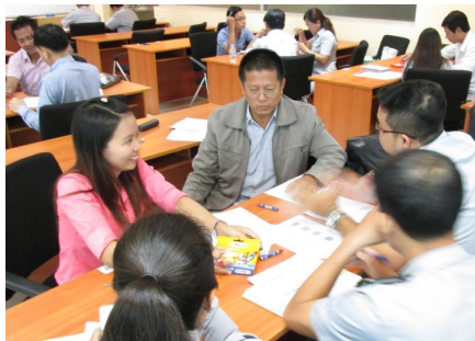
កិច្ចពិភាក្សាក្រុម