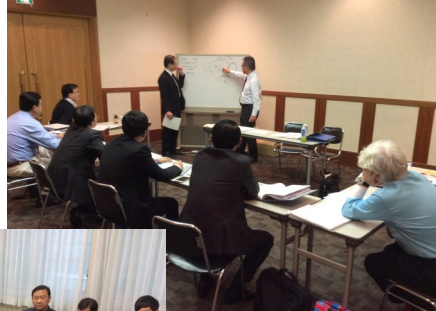
ការពន្យល់តាមលំហូរប្រតិបត្តិការ