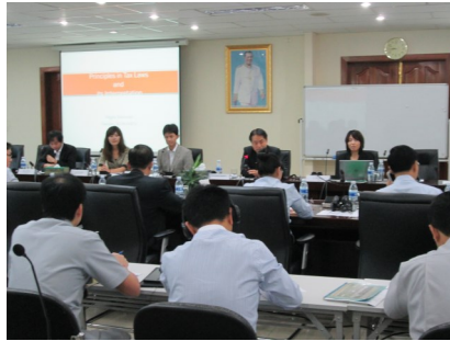
កិច្ចពិភាក្សាជាមួយមន្ត្រី

ការបង់ពន្ធ និងតម្លាភាពនៃច្បាប់ស្តីពីសារពើពន្ធ។