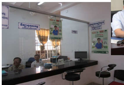
នៅការិយាល័យអាជ្ញាធរមូលដ្ឋាន

ក្រុមការងារបានរៀបចំផ្ទាំងផ្សព្វផ្សាយអំពីការអប់រំស្តីពីពន្ធដារ ព្រមទាំងបានចែកជូនសាខាពន្ធដារទាំងអស់ និងការិយាល័យអាជ្ញាធរមូលដ្ឋាន។