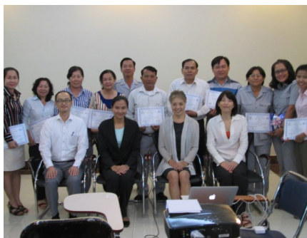
វិធីបណ្តុះបណ្តាលនៅសាលាជាតិពន្ធដារ

ពន្ធដារខេត្តទាំងអស់ផងដែរដើម្បីធ្វើឲ្យប្រសើរឡើងនូវទំនាក់ទំនងទាំងខាងក្នុង និងខាងក្រៅអង្គភាព។