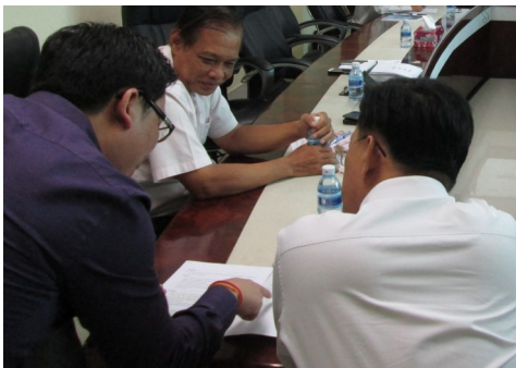
ការបញ្ជាក់អំពីបញ្ហាបកស្រាយច្បាប់

ការបង្កើតកម្រិតសន្ទនាស្តីពីការបង្កើនអំពីពន្ធលើប្រាក់ចំណេញ ខែមីនា ឆ្នាំ២០១៥