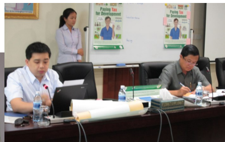
កិច្ចប្រជុំក្រុមការងារដើម្បីបញ្ចប់ផ្ទាំងផ្សព្វផ្សាយ