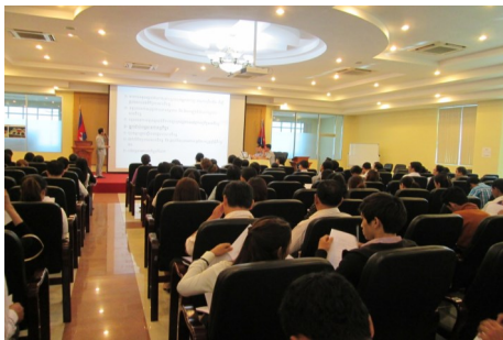
បទបង្ហាញ និងវគ្គសំណួរ និងចម្លើយ

សិក្ខាសាលាសម្រាប់អ្នកជាប់ពន្ធស្តីពីពន្ធលើប្រាក់ចំណេញសម្រាប់សាខាពន្ធដារខេត្ត ខែធ្នូ ឆ្នាំ២០១៤