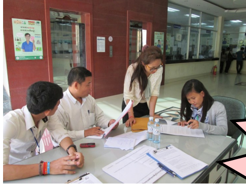
អ្នកជាប់ពន្ធផ្តល់ចម្លើយនៅក្នុងការស្ទង់មតិនៅទូលគោក

ក្រើនរំពង អពជ ឲ្យអនុវត្ត "ផែនការសកម្មភាព" ឆ្នាំ២០១៥ ដើម្បីបង្កើនភាពពេញចិត្តរបស់អ្នកជាប់ពន្ធ ទន្ទឹមនឹងនេះ ចាំបាច់ត្រូវសម្រេចឲ្យបាននូវវឌ្ឍនភាពបន្ថែមទៀត!