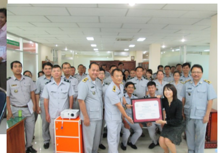
ពិធីប្រគល់វិញ្ញាបនបត្រជូនសាខាពន្ធដារ