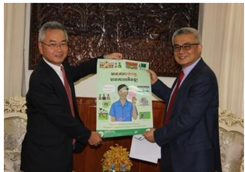
ការបង្ហាញផ្ទាំងផ្សព្វផ្សាយអំពីពន្ធដារជូនឯកឧត្តមរដ្ឋមន្ត្រី

តំណាងប្រធានការិយាល័យថៃកាប្រចាំកម្ពុជា និងគម្រោងបានរាយការណ៍អំពីការចូលរួមរបស់អង្គការថៃកាជូនក្រសួងសេដ្ឋកិច្ច និងហិរញ្ញវត្ថុ។ ឯកឧត្តមរដ្ឋមន្ត្រី បានស្នើសុំឲ្យមានកិច្ចសហប្រតិបត្តិការបន្ថែមទៀត។