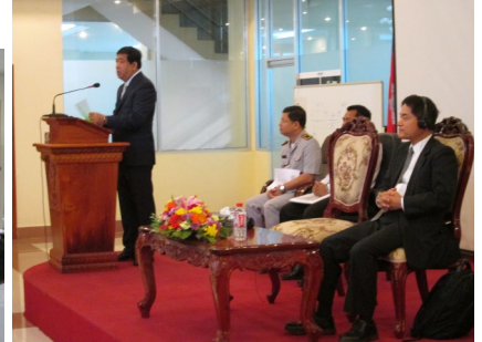
ពិធីបើកសិក្ខាសាលាសាធារណៈ