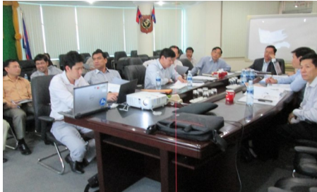
បទបង្ហាញ និងកិច្ចពិភាក្សាអំពីករណីសវនកម្ម

ការរៀបចំសៀវភៅករណីសវនកម្ម ករណីសវនកម្ម ខែមិថុនា ឆ្នាំ២០១៥