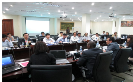
សង្ខេបសារវគ្គបណ្តុះបណ្តាលដើម្បីចែករំលែកទម្លាប់អនុវត្តល្អ

កេនយ៉ា ប្រទេសកេនយ៉ា បានបំពេញទស្សនកិច្ច នៅ អពដ ដើម្បីចែករំលែកទម្លាប់អនុវត្តល្អ បំផុត។