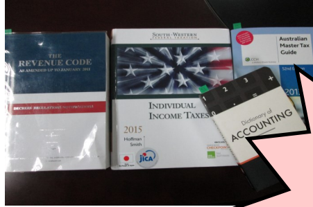
សៀវភៅណែនាំស្តីពីពន្ធដាររបស់ប្រទេសនានា

ជារៀងរាល់ឆ្នាំ គម្រោងបានទិញសៀវភៅស្តីពីពន្ធដារ និងគណនេយ្យទុកឲ្យមន្ត្រីប្រើប្រាស់ ដូចជា សៀវភៅ ណែនាំស្តីពីពន្ធដាររបស់ប្រទេសនានាអំពីវិសោធនកម្ម ច្បាប់ និងការបកស្រាយបទប្បញ្ញត្តិ។