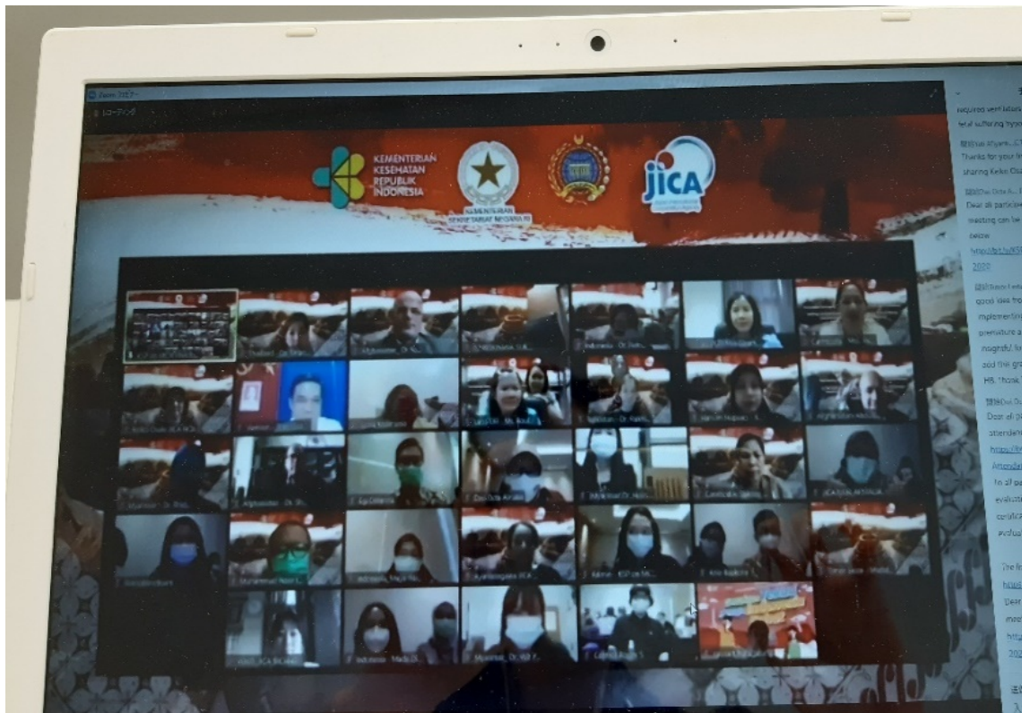
រូបភាពសិក្ខាកាមមកពីប្រទេសចំនួន ១១

Picture: The Photos during the Online Conference of all the 11 Countries Participants