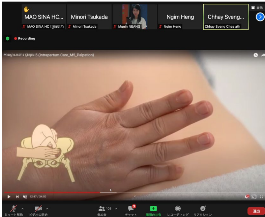
Picture: Training on Abdominal Palpation and Fetal Heartbeat Auscultation

នាថ្ងៃទី១៣, ១៤, ២០ និង ថ្ងៃទី២១ គម្រោងលើកកម្ពស់ការថែទាំបន្តនៅកម្ពុជាផ្តោតលើការថែទាំស្ត្រី និងទារកក្នុងពេលសម្រាល និងក្រោយពេលសម្រាល (JICA-IINeoC) បានរៀបចំវគ្គបណ្តុះបណ្តាលជាបន្តបន្ទាប់តាមប្រព័ន្ធអនឡាញ (zoom) ស្តីពីការថែទាំក្នុងអំឡុងពេលឈឺពោះសម្រាលនិងពេលសម្រាលដែលផ្តោតលើការស្តាប់ពោះ និងការស្តាប់ចង្វាក់បេះដូងទារក។ វគ្គបណ្តុះបណ្តាលទាំងនេះបានរៀបចំឡើងដោយសហការណ៍ជាមួយសមាគមធូបកម្ពុជា ហើយមានធូបចំនួន ២១០នាក់ នៅខេត្តកំពង់ចាម និងខេត្តស្វាយរៀង បានចូលរួមវគ្គក្នុងបណ្តុះបណ្តាលនេះ។