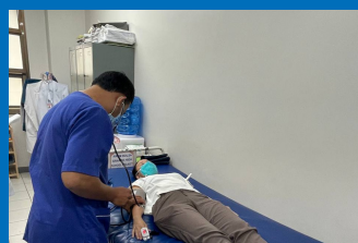
Need Assessment, Battambang Provincial Referral Hospital