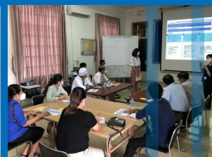
Need Assessment, Kampong Cham Provincial Referral Hospital