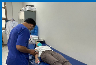
ការប៉ានប្រមាណតម្រូវការ នៅមន្ទីរពេទ្យបង្អែក ខេត្តបាត់ដំបង