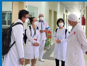
ការប្រមូលព័ត៌មាននៅមន្ទីរពេទ្យ កាលបរិច្ឆេទ