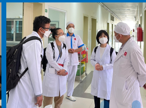
Information Collection at Calmette Hospital