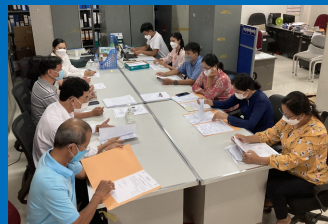
Department of Human Resource Development (MoH)