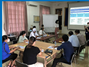
ការប៉ានប្រមាណតម្រូវការ នៅមន្ទីរពេទ្យបង្អែក ខេត្តកំពង់ចាម