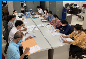
នាយកដ្ឋានអភិវឌ្ឍន៍ធនធានមនុស្ស (HRDD), ក្រសួងសុខាភិបាល