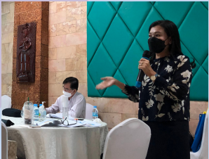
Ms. Prak Manila during the workshop