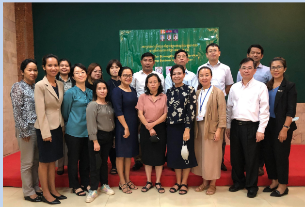
All the participants of the 3rd workshop

បន្ទាប់ពីសិក្ខាសាលាលើកទី ៣ នេះ សមាជិក ក្រុមការងារបច្ចេកទេសនឹងបន្តធ្វើការដើម្បីបញ្ចប់កិច្ចការណ៍ណែនាំជាតិសម្រាប់ការអភិវឌ្ឍន៍ និងគាំទ្រ សម្រាប់ដំណើរការអនុម័តនៅក្រសួងសុខាភិបាល ។