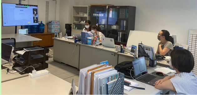
1st Study Session for Developing INSET Plan, NMCHC