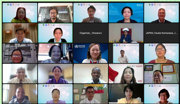
Workshop participants from various countries and organizations

On 27th Feb, the 1st study session for developing INSET plan was conducted to present the two following topics: