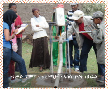
የገመድ ፓምፕ ተጠቃሚዎች አሰሳ ጥናት በከፊል

ማንኛውንም አስተያየት ፣ ጥያቄዎች ሐሳብ ካላችሁ በዚህ አድራሻ ተጠቀሙ ጃይካ ሮፕ ፓምፕ ፕሮጀክት • ክፍል # 016, በዉሃና ኢነርጂ ሚኒስቴር • ስልክ: +251 - (0)11-651-1455 • ሞባይል: +251 - (0)935-353210/11