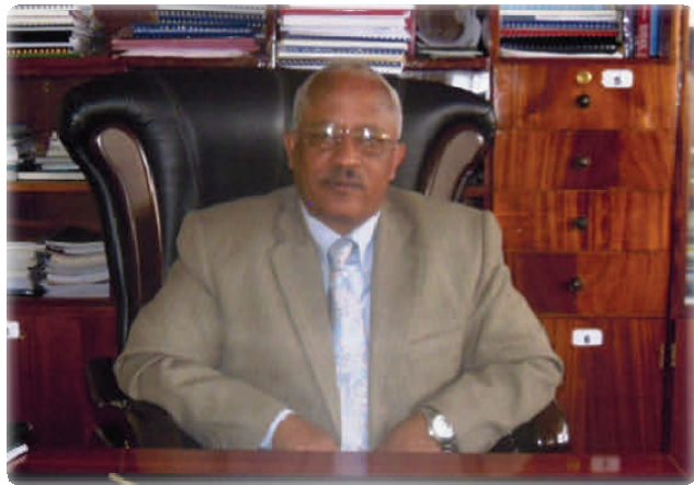
ክቡር አቶ አለማየሁ ተገኑ ሚኒስትር, ዉሃና ኢነርጂ ሚኒስቴር

ለዚህ ኒዉስ ሌተር (ዜና ገመድ ፓምፕ) የእንኳን ደህና መጣችሁ መልዕክት ሲያስተላልፉ የዉሃና ኢነርጂ ሚኒስትር ክቡር አቶ አለማየሁ ተገኑ በዚህ ፕሮጀክት ላይ ያላቸዉን ታላቅ ተስፋ ገልፀዋል። በኢትዮጵያ ውስጥ የሚካሄዱ የዉኃ አቅርቦት እና ሳኒቴሽን ሥራዎች ህዝባችንን የሚረዱ በጣም ጠቃሚ የሆኑ እንቅስቃሴዎች ናቸዉ። የንፁህ መጠጥ ዉሃ አቅርቦት ለሀገራችን እድገት መፋጠን እና ለህዝቡ ጤና መሻሻል የሚጫወተዉ ሚና ትልቅ ነዉ። በገጠር ያሉትን አርሶ አደሮች ከመርዳቱም በላይ በኢኮኖሚያዊ ማህበራዊ፤ እና በፓለቲካዊዉ እንደምታ ላይ የሚያሳደረዉ ተፅዕኖ የትየለሌ ነዉ። በ2007 ዓ.ም የዉሃ አቅርቦትን ሽፋን ወደ 98.5 % ለማድረስ ያቀድን ሲሆን፤ ለዚሁ የቀረን ጊዜ ሁለት ዓመት ብቻ ነዉ። አሁን ያለንበት የዉሃ አቅርቦት ሽፋን 61.1% ላይ ነዉ ። ይህ የሚያሳየን ብዙ መሥራት እንዳለብን ነዉ። ላስቀመጥነዉ ግባችን ይረዳን ዘንድ ይህን በጃፓን አለም አቀፍ ትብብር ኤጀንሲ (JICA) እገዛ የሚከናወነዉን ገመድ ፓምፕን ለመጠጥ ዉሃ በማሰራጨት የገጠርን የንፁህ መጠጥ ውኃ አቅርቦት፤ንፅሕና (ሳኒቴሽን) እና ኑሮን የማሻሻል ፕሮጀክት ተግባራዊ ለማድረግ ሚኒስቴር መስሪያ ቤታችን ሙሉ እገዛ ለመስጠት ዝግጁ መሆኑንም ገልፀዋል።