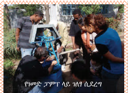
የገመድ ፓምፕ ላይ ገለፃ ሲደረግ