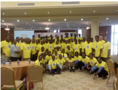
የቢዚነስ ስኬል ስልጠና እንዴት ለባለገመድ ፓምፕ ስርጭት የገበያ እንቅስቃሴ ዙሪያ ውይይት ተደርጓል። ተሳታፊዎች በስልጠናው ማጠናቀቅያ ላይ የተሰጡት ፎቶ /ኦ.ኤ.አ መጋቢት 22 2016/