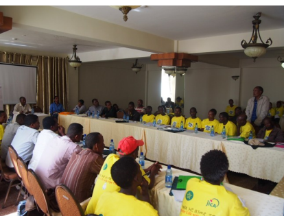
የአጭ ማይከሮ ፋይናንስ ኢንሰይቲቭ የአክባቢ ባለሙያዎች እና የወረዳ የመንግስት አካላት በብድር አከፋፈል ዙሪያ ያደረጉት ውይይት በከፋል (ኦ.ኤ.አ መጋቢት 21 2016)