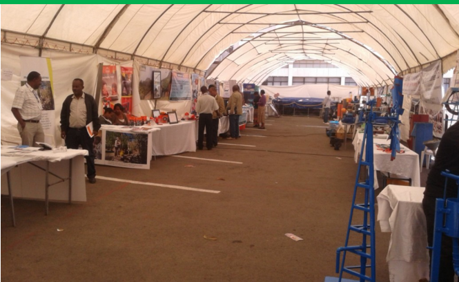
የተለያዩ ተዋናዮች በኤግዚብሽን ላይ ተከፍለዋል (የኤግዚብሽን ገዕታ በከፊል)

ከባለፈው አመት ልምድ በመነሳት ብሔራዊው የራስ አገዝ / Self Supply/ ግብረ ሀይል የውሃ ቀንን ምክንያት በማድረግ ለሶስት ቀናት ማለትም እ.ኤ.አ.ከመጋቢት 18 እስከ 21 2018ዓ.ም አዘጋጅቶ ነበር።