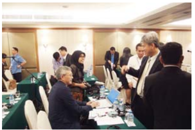
ການສົນທະນາແລກປ່ຽນ ໃນກອງປະຊຸມລະຫວ່າງໂຄງການ

ແລະກໍ່ຄາດຫວັງວ່າການສົນທະນາທີ່ເລິກເຊິ່ງ ໃນ 4 ຫົວຂໍ້ຂ້າງເທິງນີ້ຈະມີຂຶ້ນໃນກອງປະຊຸມລະຫວ່າງໂຄງການຄັ້ງຕໍ່ໄປ.