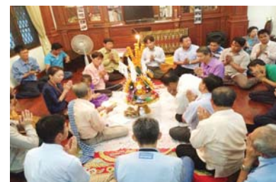
Baci traditional ceremony for success of a series of seminars and meetings