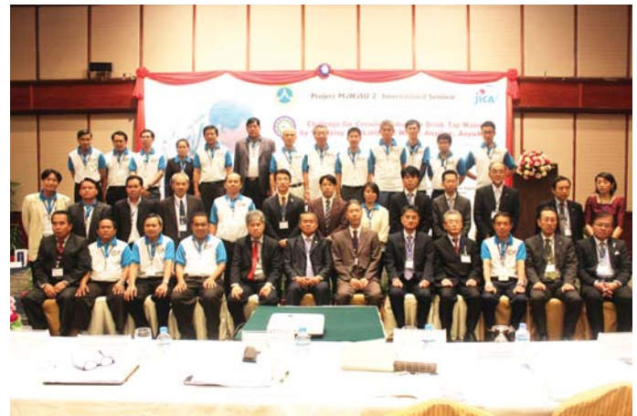
Group photo of Project MaWaSU 2nd International Seminar