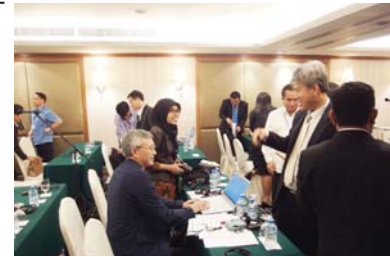
Informal talk, good feature of P2P Meeting

The 4th P2P Meeting featured general information of each country and overall efforts for “Creating a culture to drink tap water in your country” because there were many countries to participate in the P2P Meeting for the first time. Therefore, following the contents of the previous declaration of MaWaSU 2013, Declaration of MaWaSU 2014 confirmed continuous efforts on (1) Provision of good water service to customers, (2) Implementation of Water Safety Plan, (3) Keeping clean office and water supply facilities and (4) Customer relations including customer education. It is expected that in-depth discussion on the above 4 issues will be made in the next P2P Meeting.