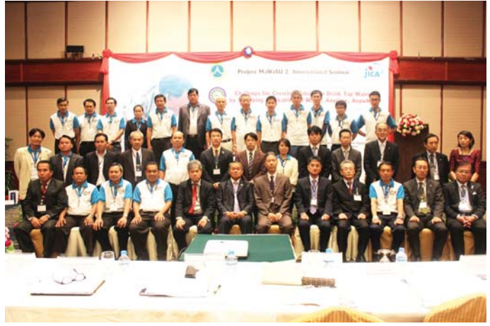
ຖ່າຍຮູບລວມ ຄະນະນຳ ກອງປະຊຸມສຳມະນາສາກົນ ຄັ້ງທີ 2 ໂຄງການ MAWASU