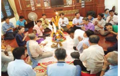
ພິທີປາສີສູ່ຂວັນເພື່ອຕ້ອນຮັບແຂກທີ່ມາເຂົ້າຮ່ວມກອງປະຊຸມ