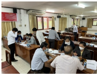
(ຮບປະກອບ) ການເຮັດວຽກ ເປນກມ