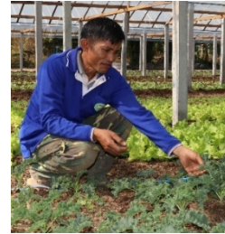
ຮບພາບ ) ທ. ທັດສະນີ ທີ່ສວນປກຝັກອິນ ຊີ

ໃນສະບັບນີ້, ມີການຮວບຮວມ ຄາຄິດເຫັນ ຂອງພາກສວນຫຼັກ ທີ່ກຽວຂອງ ກັບ ການສົ່ງເສີມກະສິກາອິນຊີ ໃນບັນດາແຂວງເປາໝາຍ. ເຊິ່ງຄັ້ງນີ້, ພວກ ເຮົາໄດຍົກໃຫ້ເຫັນກໍລະນີຂອງ ທ. ທັດສະນີ, ຊາວກະສິກອນອິນຊີ ບານ ທາ ຊາງ, ເມືອງ ປາກງື່ມນະຄອນຫຼວງວຽງຈັນ.