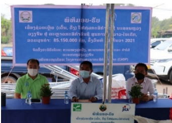
(ຮບປະກອບ) ຜິທິ ມອບ-ຮັບ ທີ່ ຕະຫຼາດອິນຊີ ສນ ການຄາລາວໄອ ເຕັກ

ເຖິງແມ່ນວາ ເຊື້ອຜະຍາດໂຄວິດ-19 ຍັງຄົງແຜລະບາດຢູ່ໃນສັງຄົມກຳຕາມ, ຕະຫຼາດກະສິກາອິນຊີ ນະຄອນຫຼວງວຽງຈັນ ກໍຍັງໄດສືບຕໍ່ເປດ ຢາງຕໍ່ເນື່ອງ. ໃນລະຫວາງເດືອນ ມັງກອນ ປ 2022 ນີ້, ການເປດຕະຫຼາດກະສິກາອິນຊີໄດ ມີ ການຈັດແບງຕາມວັນເວລາ ແລະ ສະຖານທີ່ ດັ່ງນີ້, ຢທີ່ສນການຄາ ລາວ ໄອເຕັກ ແມນ ມີທັງໝົດ 3 ມື້/ອາທິດ (ວັນຈັນ,ວັນພດ,ວັນເສົາ), ຢວຽງຈັນ ເຊັ່ນເຕີ 3 ມື້/ອາທິດ (ວັນພດ,ວັນສກ,ວັນອາທິດ) ແລະ ຢບານ ດົງນາໂຊກ 2 ມື້/ອາທິດ (ວັນຈັນ,ວັນພະຫັດ).