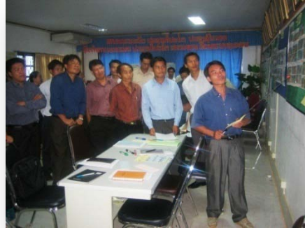
ກອງປະຊຸມການປະເມີນຜົນຂອງການປະເມີນທີ່ແຂວງອຸດົມໄຊ, ເດືອນມິຖຸນາ 2008