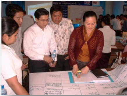
ການຝຶກອົບຮົມການຄຸ້ມຄອງໂຄງການລົງທຶນ ລັດທີ່ແຂວງຜົ້ງສາລີ, ເດືອນມັງກອນ 2010