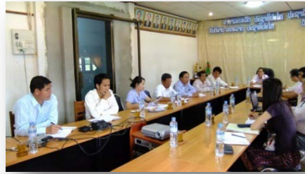
ການປະເມີນຜົນຕອນທ້າຍໂຄງການຂອງອົງການ ໄຈກາ, ເດືອນມີນາ 2011