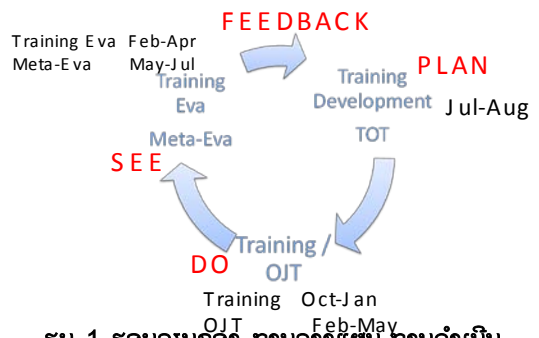
ຮູບ 1 ຮອບວຽນຂອງ ການວາງແຜນ-ການດໍາເນີນ ການ-ການຕິດຕາມ-ການປະກອບຄໍາເຫັນ

ການ-ການຕິດຕາມ-ການປະກອບຄໍາເຫັນ ເພື່ອສ້າງທັກສະດ້ານການຄຸ້ມຄອງ PIP ໃຫ້ສາມາດນໍາໃຊ້ໄດ້ໃນທາງປະຕິບັດ ພາຍໃນອົງການກ່ຽວຂ້ອງອື່ນໆ (ເບິ່ງຮູບ 1).