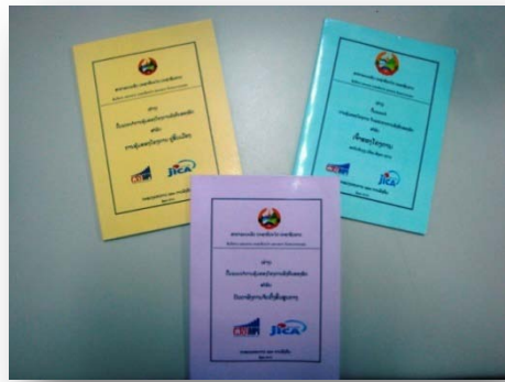
ບັນດາປຶ້ມຄູ່ມື ແລະ ປຶ້ມບົດແນະນຳ