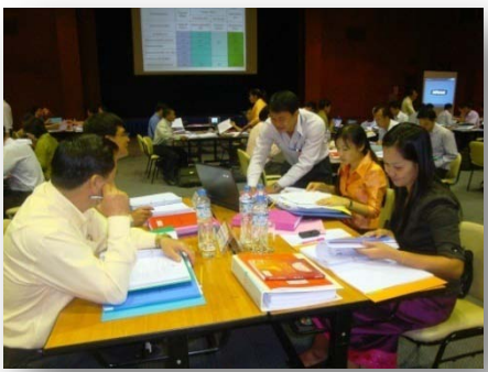
ການຝຶກອົບຮົມການຄຸ້ມຄອງໂຄງການລົງທຶນລັດຂັ້ນກະຊວງ, ເດືອນກຸມພາ 2010