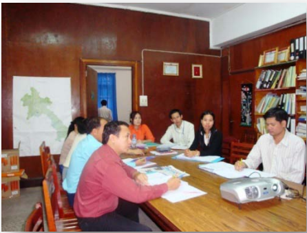
ການຝຶກອົບຮົມ (TOT) ຂອງກະຊວງແຜນການ ແລະ ການລົງທຶນ, 2010