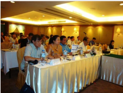
ກອງປະຊຸມ JCC ຮັ່ງທີ 4, ເດືອນມີນາ 2010