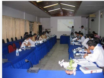
ກອງປະຊຸມການປະເມີນຜົນຂອງການປະເມີນທີ່ ກະຊວງໂຍທາ ແລະຂົນສົ່ງ, ເດືອນກໍລະກົດ 2008