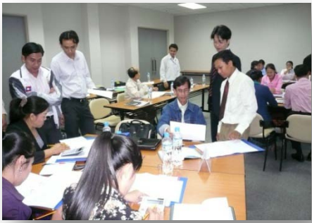
ການຝຶກອົບຮົມການຄຸ້ມຄອງທາງດ້ານການ ເງິນສຳລັບຂັ້ນສູນກາງ, ເດືອນມັງກອນ 2010