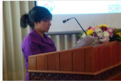
ກອງປະຊຸມ JCC ຄັ້ງທີ 6, ເດືອນ ກໍລະກົດ 2010