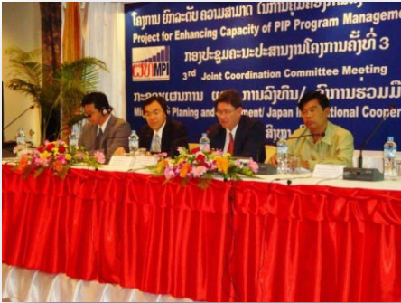
ກອງປະຊຸມຄະນະປະສານງານຮ່ວມຮັ່ງທີ 3 (3 rd JCC), ເດືອນສິງຫາ 2009