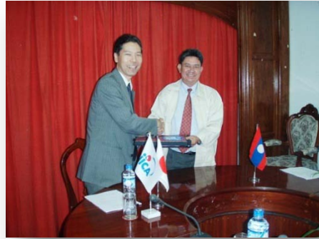
ການປະເມີນຜົນໄລຍະກາງຂອງອົງການ JICA, ເດືອນທັນວາ 2009