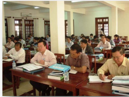
ການຝຶກອົບຮົມໃຫ້ແກ່ບັນດາເຈົ້າຂອງໂຄງການຢູ່ບັນດາແຂວງ, ເດືອນທັນວາ 2010