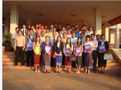
ການຝຶກອົບຮົມການຄຸ້ມຄອງໂຄງການລົງທຶນລັດທີ່ນະຄອນຫຼວງວຽງຈັນ, ເດືອນພະຈິກ 2010