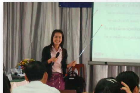
ການຝຶກອົບຮົມການຄຸ້ມຄອງໂຄງການລົງທຶນລັດທີ່ນະຄອນຫຼວງວຽງຈັນ, ເດືອນພະຈິກ 2010