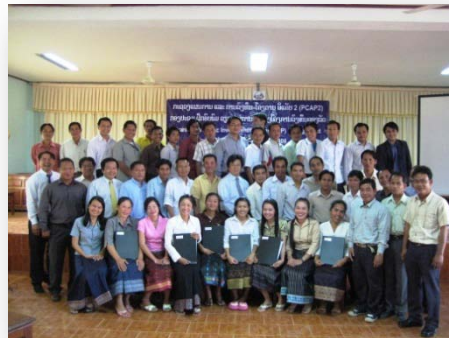
ການຝຶກອົບຮົມການຄຸ້ມຄອງໂຄງການລົງທຶນລັດ, ເດືອນທັນວາ 2008