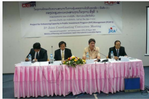
ກອງປະຊຸມ JCC ຮັ່ງທີ 5, ເດືອນສິງຫາ 2010