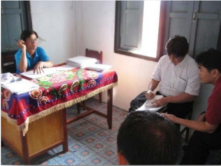
ການລົງສຳພາດທີ່ ແຂວງ ສາລະວັນ, ເດືອນທັນວາ 2008