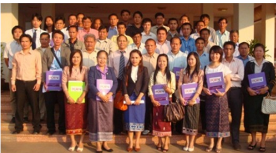
ການສຳມະນາທີ່ເນັ້ນໃສ່ຜູ້ເຂົ້າຮ່ວມຈາກແຂວງພາກກາງແລະພາກໃຕ້ (ເດືອນ11 ວັນທີ່ 1-2)

ໃນຊ່ວງວັນທີ່ 1-4 ເດືອນ 11 ປີ 2010 ນັ້ນ, ກອງປະຊຸມສຳມະນາຂະບວນການຄຸ້ມຄອງການລົງທຶນຂອງລັດ ແລະ ການຄຸ້ມຄອງທາງດ້ານການເງິນການລົງທຶນຂອງລັດໄດ້ໄຂຂຶ້ນ ໂດຍເນັ້ນໃສ່ຜູ້ເຂົ້າຮ່ວມທີ່ເປັນຫົວໜ້າແລະຮອງຫົວໜ້າພະແນກ ແຜນການ ແລະ ການລົງທຶນຈາກ 16 ແຂວງ ແລະ ຈາກນະຄອນຫຼວງວຽງຈັນ. ຜູ້ເຂົ້າຮ່ວມທັງໝົດໄດ້ຮັບຈັກຄິດໄລ່ເລກໜຶ່ງອັນ ແລະ ໄດ້ທຳການວິເຄາະສະພາບທາງດ້ານການເງິນການລົງທຶນຂອງລັດໃນແຕ່ລະແຂວງ, ພາຍຫຼັງໄດ້ຮັບຜົນຂອງການວິເຄາະແລ້ວ ຜູ້ເຂົ້າຮ່ວມກໍ່ໄດ້ສະຫຼຸບ ແລະ ທາວິທິການປັບປຸງແກ້ໄຂທາງດ້ານການເງິນໄລຍະກາງ ແລະ ລາຍລະອຽດກິດຈະກຳ ທີ່ຈຳເປັນອື່ນໆ. ສຳຫຼັບວິທິການປັບປຸງແກ້ໄຂທີ່ສັງເກດເຫັນໄດ້ໂດຍທົ່ວໄປແລ້ວປະກອບມີ 1. ພະຍາຍາມບໍ່ເພີ່ມລາຍຈ່າຍທີ່ຈຳເປັນ, 2. ຫຼຸດໄລຍະເວລາການຈ່າຍໃຫ້ສັ້ນລົງ, 3. ເຂົ້າໃຈສະພາບການຂາດແຄນງົບປະມານ ແລະ ໃຊ້ງົບປະມານຢ່າງມີປະສິດທິຜົນ. ເຖິງຢ່າງໃດກໍ່ຕາມ, ໄດ້ມີຜູ້ເຂົ້າຮ່ວມສ່ວນໜຶ່ງໄດ້ໃຫ້ທັດສະນະວ່າ ຖ້າຢາກຄວບຄຸມການເພີ່ມຂຶ້ນຂອງງົບປະມານການໃຊ້ຈ່າຍ ແມ່ນຈະຕ້ອງໄດ້ຄວບຄຸມງົບປະມານການໃຊ້ຈ່າຍເຂົ້າໃນໂຄງການໃໝ່ ຊຶ່ງສິ່ງນີ້ ຈະເຮັດໃຫ້ແຜນພັດທະນາເສດຖະກິດສັງຄົມຂອງແຂວງ ໃນໄລຍະ 5 ປີຂ້າງໜ້າ ບໍ່ສາມາດບັນລຸເປົ້າໝາຍໄດ້, ໂດຍໃນພາກປະຕິບັດຕົວຈິງ ບັນຫານີ້ຈະຍັງຄົງຂ້າງສືບຕໍ່ໄປ. ນອກຈາກນັ້ນແລ້ວຍັງມີຄຳແນະນຳໃຫ້ຈັດມີການຝຶກອົບຮົມດ້ານການຕັດສິນໃຈໃຫ້ ບັນດາເຈົ້າແຂວງແລະຮອງເຈົ້າແຂວງ, ສ່ວນການສ້າງເນື້ອໃນການຝຶກອົບຮົມກຸ່ມກັບການນຳໃຊ້ແຜນງົບປະມານການຄຸ້ມຄອງການລົງທຶນຂອງລັດແລ້ວ ຈະຕ້ອງມີການສົ່ງເສີມຄວາມເຂົ້າໃຈກຸ່ມກັບຂະບວນການຕັດສິນໃຈ, ໂດຍມີຄວາມຈຳເປັນຕ້ອງເນັ້ນໄປໃສ່ກະຊວງແຜນການແລະການລົງທຶນແລ້ວລົງໄປສູ່ແຂວງຕ່າງໆ.