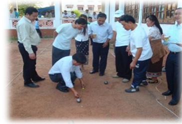
ພະນັກງານ MPI ກຳລັງວັດແທກຜົນເປຕັ້ງດ້ວຍຄວາມຕັ້ງໃຈ

ຄວາມພະຍາມເຫຼົ່ານີ້ສາມາດເຮັດໄດ້ຢ່າງທີ່ວ່າແລ້ວ ຈະບໍ່ກໍ່ໃຫ້ເກີດບັນດາວຽກ ທີ່ບໍ່ທັນກຳໜົດເວລາ, ຫຼືເວົ້າອີກຢ່າງໜຶ່ງກໍ່ຄື ຈະຕ້ອງລະມັດລະວັງ ສະຖານລະພາບທາງການເງິນ ທີ່ຈະມີຜົນກະທົບຕໍ່ວຽກງານໃໝ່ ເຊິ່ງທີ່ຜ່ານມາໄດ້ກໍ່ໃຫ້ເກີດສະພາບຄວາມຫຍຸ້ງຍາກໃນການຕັດສິນໃຈຫຼາຍຢ່າງ. ສິ່ງເຫຼົ່ານີ້ໄດ້ກໍ່ໃຫ້ເກີດຄວາມເປັນຫວ່ງເປັນໃຍຂຶ້ນ ໂດຍຜູ້ເຂົ້າຮ່ວມຫຼາຍທ່ານໄດ້ຕັ້ງຄຳຖາມຂຶ້ນມາວ່າ ຖ້າຫາກເຂົາໃຈລາຍການຂອງການຝຶກອົບຮົມທຸກຢ່າງແລ້ວ, ຈະສາມາດນຳໃຊ້ເຂົ້າໃນຂະບວນການເຮັດຕົວຈິງໄດ້ຫຼືບໍ່ ເພາະຖ້າບໍ່ມີຂໍ້ມູນ ແລະ ຕົວເລກທີ່ຖືກຕ້ອງແລ້ວ ອາດຈະບໍ່ສາມາດເຮັດໃຫ້ເປັນທີ່ເຊື່ອຖືໄດ້.