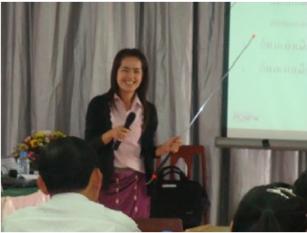
ພະນັກງານວາງແຜນແລະການລົງທຶນຂອງແຂວງສະຫວັນນະເຂດ ດຳເນີນ ການຈຳລອງ ແບບຝຶກການຄຸ້ມຄອງຄູ່ຮ່ວມກອງທຶນຂອງ ODA

ໄດ້ມີການຝຶກອົບຮົມຜູ້ຝຶກສອນຂຶ້ນ ໂດຍໃນຊ່ວງວັນທີ 8-12 ເດືອນ ພະຈິກ ປີ2010 ທີ່ຜ່ານມານັ້ນໄດ້ຈັດໃຫ້ ພະແນກແຜນການ ແລະການລົງທຶນ 4 ແຂວງ ພາກກາງ ແລະ ນະຄອນຫຼວງວຽງຈັນ, ວັນທີ 15-19 ແມ່ນຈັດໃຫ້ພະແນກ ແຜນການ ແລະ ການລົງທຶນຂອງ 6 ແຂວງພາກເໜືອແລະພາກໃຕ້ຕາມລຳດັບ. ເມື່ອໂຄງການ PCAP2 ໄດ້ເລີ່ມຕົ້ນຂຶ້ນ, ພະນັກງານພະແນກແຜນການ ແລະ ການລົງທຶນຂອງແຂວງ ແມ່ນບໍ່ໄດ້ຮັບການຖ່າຍທອດເທັກໂນໂລຊີໃໝ່ໃດໆ ແຕ່ ສິ່ງທີ່ພວກເຂົາໄດ້ຮັບກໍຄື ການຝຶກສອນໃຫ້ເປັນຜູ້ສືບສອນໂດຍສິ່ງນີ້ໄດ້ກາຍເປັນ ບາດກ້າວໜຶ່ງທີ່ມີຄວາມໝາຍສຳຄັນ. ແລະ ໃນເດືອນຕໍ່ໄປ ແຂວງຈະກາຍເປັນ ຈຸດໃຈກາງ ເພື່ອດຳເນີນການຝຶກອົບຮົມການຄຸ້ມຄອງດ້ວຍຕົນເອງ, ໂດຍໃຊ້ ລະດັບຄວາມເອົາຈິງເອົາຈັງທີ່ແຕກຕ່າງກັນໄປ. ເນື້ອຫາແຕ່ລະຢ່າງນັ້ນ ແມ່ນ ໄດ້ມີການທົບທວນຄຳຖາມຢ່າງຖີ່ຖ້ວນ ຈົນເກີດຄວາມເຂົ້າຢ່າງແທ້ຈິງ ພ້ອມກັນ ນັ້ນກໍໄດ້ມີການຈຳລອງການຍື່ນຢູ່ເທິງເວທີ ເພື່ອທຳການຝຶກຊ້ອມວິທີການການນຳ ສະເໜີ. ພາຍຫຼັງການຝຶກຊ້ອມເຫຼົ່ານີ້ແລ້ວ ໃນທີ່ສຸດພວກເຂົາກໍຈະສາມາດເວົ້າ ໄດ້“ຕໍ່ຈາກນີ້ໄປພວກເຮົາຈະມີບົດບາດສູງຂຶ້ນແລ້ວ” ແລະຈະກໍ່ໃຫ້ເກີດຄວາມໝັ້ນ ໃຈ,ຄວາມຮັບຜິດຊອບ, ແລະ ຄວາມປະທັບໃຈຫຼົງເຫຼືອຢູ່. ພະແນກແຜນການ ແລະ ການລົງທຶນຂອງແຂວງຫວັງເປັນຢ່າງຫຍິ່ງວ່າ, ວິທີການການຄຸ້ມຄອງການ ລົງທຶນຂອງລັດ. ຈະກາຍເປັນເຄື່ອງມືຖ່າຍທອດແລະກໍ່ໃຫ້ເກີດປະໂຫຍດ