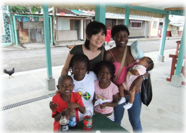
ຖ່າຍຢູ່ເຕາະຄາລິບຽນ, ໃນເຂດເຊັ່ນໂຕເຊຍ

ຍ້ອນວ່າເນື້ອຫາຂອງ PCAP2 ເປັນໂຄງການເບິ່ງຄ້າຍຄືຈະຫຍຸ້ງຍາກຫຼາຍ, ດັ່ງນັ້ນຂ້ອຍຈຶ່ງສູ້ຊົນ ແລະ ຕັດສິນໃຈມາປະເທດລາວ. ເມື່ອໄດ້ມາຮອດປະເທດລາວແລ້ວ ຂ້ອຍໄດ້ມີພູ່ຮ່ວມງານທີ່ດີ ຢູ່ຫ້ອງການກໍ່ມີພະນັກງານທ້ອງຖິ່ນທີ່ເກັ່ງເຮັດໃຫ້ການເຮັດວຽກງານຕ່າງໆດຳເນີນໄປດ້ວຍຄວາມສະດວກສະບາຍ, ແລະຄວາມຮູ້ສຶກເປັນກັງວົນໃນເບື້ອງຕົ້ນຂອງຂ້ອຍກໍ່ຫາຍໄປ. ນະຄອນວຽງຈັນເປັນຕົວເມືອງທີ່ນ່າຢູ່, ເຮັດໃຫ້ຊີວິດການເຮັດວຽກ ໃນແຕ່ລະມື້ຂອງຂ້ອຍມີຄວາມໝາຍຫຍິ່ງຂຶ້ນ. ຂ້ອຍຍາກຮຽນພາສາລາວ ສະນັ້ນ ກາລຸນາ ສອນຂ້ອຍແດ່.