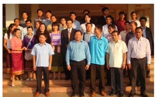
ການສຳມະນາທີ່ເນັ້ນໃສ່ຜູ້ເຂົ້າຮ່ວມຈາກແຂວງພາກເໜືອ (ເດືອນ11 ວັນທີ່ 3-4)