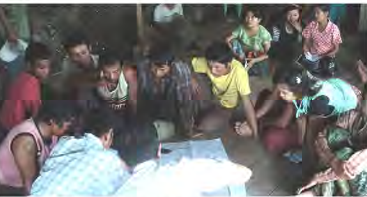
CFUSG Workshop in Kwa Kwa Ka Lay village

CF User Groups (CFUSGs) in the re-selected targeted 6 villages are expected to prepare CF Management Plan and get CF certificate from the Forest Department (FD). During April to May 2011, the CF Management Plans of these 6 CFUSGs were updated. However, in most of the CFUSGs, the contents of the Management Plans was not fully understood/shared even among the Management Committee (MC) members of the CFUSG, and/or information included in the Management Plans were out of dated. Therefore, in order to finalize more practical Management Plans and to prepare CFUSG by-laws, series of CF Management Plan/CFUSG confirmation workshops (CFUSG workshops) have been carried on in each target village. The series of the workshop were started from July and currently in process of 5 th workshop as of December, 2011.