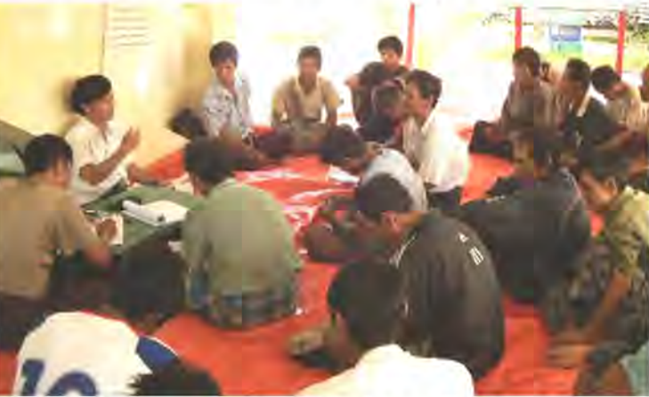
CFUSG Workshop in Thar Yar Kone village

CF User Groups (CFUSGs) in the re-selected targeted 6 villages are expected to prepare CF Management Plan and get CF certificate from the Forest Department (FD). During April to May 2011, the CF Management Plans of these 6 CFUSGs were updated. However, in most of the CFUSGs, the contents of the Management Plans was not fully understood/shared even among the Management Committee (MC) members of the CFUSG, and/or information included in the Management Plans were out of dated. Therefore, in order to finalize more practical Management Plans and to prepare CFUSG by-laws, series of CF Management Plan/CFUSG confirmation workshops (CFUSG workshops) have been carried on in each target village. The series of the workshop were started from July and currently in process of 5 th workshop as of December, 2011.