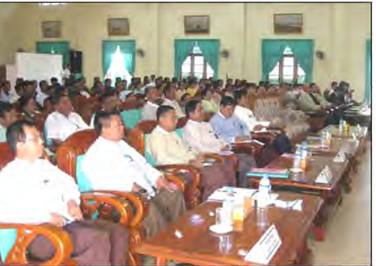
Participants of the Regional Mangrove Coordination Meeting