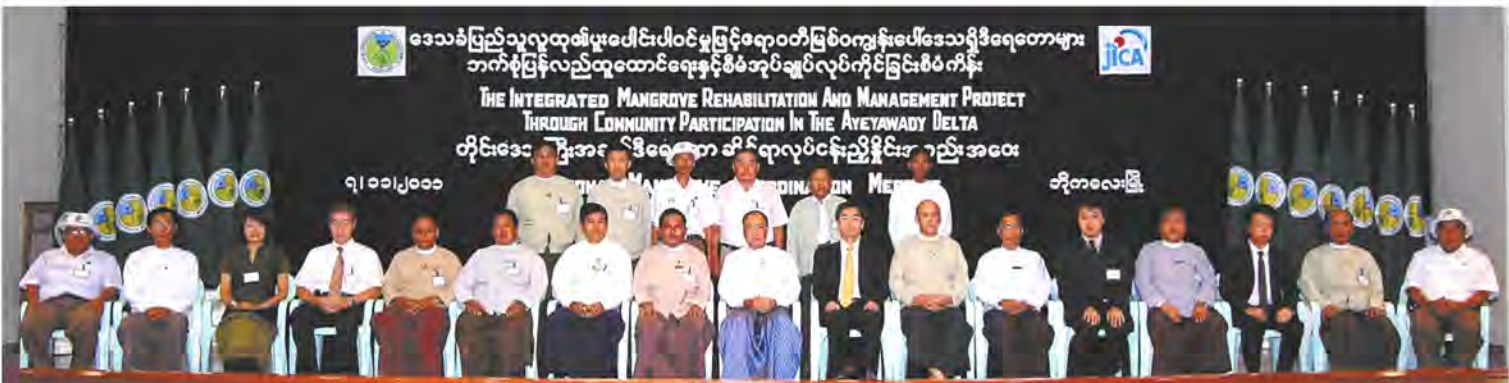
Group photo at the Regional Mangrove Coordination Meeting held on 7 th November, 2011

ဒေသခံပြည်သူလူထုပူးပေါင်းပါဝင်မှုဖြင့် ဧရာဝတီမြစ်ဝကျွန်းပေါ်ဒေသရှိ ဒီရေတောများ ဘက်စုံပြန်လည်ထူထောင်ရေးနှင့် စီမံအုပ်ချုပ်လုပ်ကိုင်ခြင်းစီမံကိန်း