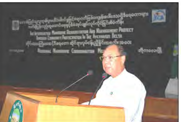
Opening speech of Union Minister U Win Tun, MOECA

စီမံကိန်းသည် ၂၀၁၁ ခုနှစ်၊ ဩဂုတ်လတွင် ဗဟိုသစ်တောလုပ်ငန်း ဖွံ့ဖြိုးမှုလေ့ကျင့်ပညာပေးရေးဌာန (CFDTC) ၌ စီမံကိန်းနယ်မြေမှ တာဝန်ခံသစ်တောဝန်ထမ်းများ နှင့်အတူ "CF လုပ်ထုံးလုပ်နည်းများ (CF-SOP)" နှင့် "သုတေသနစိုက်ခင်းဆိုင်ရာ (ARP)" အစည်းအဝေးများကို ကျင်းပပြုလုပ်ခဲ့ပါသည်။ ၂၀၁၁ ခုနှစ် ဩဂုတ်လ ၃ ရက်မှ ၅ ရက်အထိ ကျင်းပပြုလုပ်သော သုတေသနစိုက်ခင်းဆိုင်ရာ အစည်းအဝေးသို့ တက်ရောက်လာသူများသည် သုတေသနစိုက်ခင်းလုပ်ငန်းများမှ ရရှိလာသော အတွေ့အကြုံများကို အပြန်အလှန် ဆွေးနွေးခဲ့ကြပြီး လက်တွေ့ကျသော နည်းပညာများကို အတည်ပြုခဲ့ကြပါသည်။ ထိုဆွေးနွေးပွဲမှ ရရှိလာသော ဆွေးနွေး ဆုံးဖြတ်ချက် ရလဒ်များကို "နည်းပညာဆိုင်ရာ လမ်းညွှန်ချက်များ" နှင့် "နည်းပညာဆိုင်ရာ အစီရင်ခံစာ" တို့တွင် ထည့်သွင်း ဖော်ပြသွားမည် ဖြစ်ပါသည်။ ၂၀၁၁ ခုနှစ် ဩဂုတ်လ ၂၄ ရက်မှ ၂၆ ရက်အထိ ကျင်းပပြုလုပ်သော CF လုပ်ထုံးလုပ်နည်းများဆိုင်ရာ အစည်းအဝေးသို့ တက်ရောက်လာသူ များသည် CF လုပ်ငန်း ကွင်းဆင်းဆောင်ရွက်နေသော အဖွဲ့ ၏ အခန်းကဏ္ဍနှင့် တာဝန်ဝတ္တရားများ၊ ဆောင်ရွက်ရန် လုပ်ငန်းများနှင့် လိုအပ်ချက်များ၊ ပြဿနာများ၊ စီမံကိန်းနှင့်ဆက်နွှယ်သော သူများအတွက် လိုအပ်သော သင်တန်းများ၊ ဆွေးနွေးပွဲရလဒ်များကို ပြန်လည် အတည်ပြုခဲ့ကြပါသည်။ အဆိုပါဆွေးနွေးပွဲရလဒ်များကို နောင်တွင် ပြုလုပ်မည့် သင်တန်းများနှင့် CF လုပ်ထုံးလုပ်နည်းများတွင် ထည့်သွင်း ပြင်ဆင်ရန် အကြံပြုသွားမည်ဖြစ်ပါသည်။