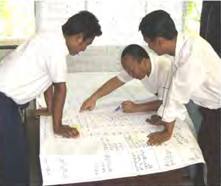
Group work in ARP Residential Meeting

In August, 2011, Residential Meetings for CF-SOP (Standardized Operational Procedure) and ARP (Action Research Plantation), participated by field-level FD counterparts, were conducted using facilities of Central Forestry Development and Training Centre (CFDTC; constructed by Japanese Grant Aid Scheme). In the ARP Residential Meeting (3-5 August), the participants shared experiences gained from ARP activities and confirmed/discussed about practical techniques. Results of this meeting will be reflected into "Technical Guideline" and "Technical Report" as outputs. On the other hand, in the CF-SOP Residential Meeting (24-26 August), the participants reconfirmed roles and responsibility of field level Mangrove CF Taskforce (MCFT), required activities and resources, issues and problems, and training needs among concerned field level stakeholders, and results of this meeting will contribute to the further preparation of training programs and CF-SOP.