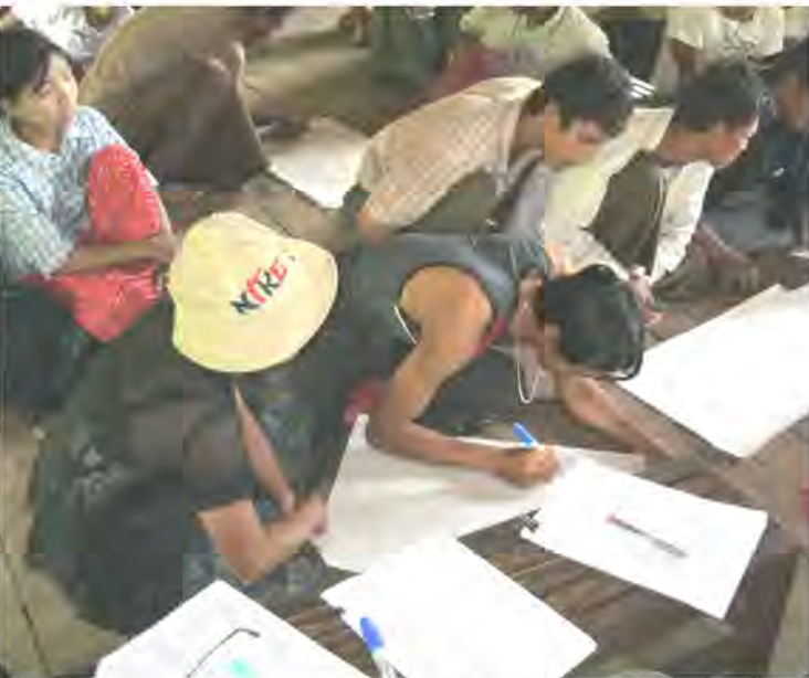
CFUSG Workshop in Nyaung Ta Pin village

ပြန်လည်ရေးချယ်ထားသော စီမံကိန်းကျေးရွာ (၆)ရွာမှ ဒေသခံပြည်သူ အစုအဖွဲ့ဝင်သစ်တောလုပ်ငန်းအသုံးပြုသူအဖွဲ့များ (CFUSGs) သည် သစ်တောဦးစီးဌာနမှ CF တည်ထောင်သူလက်မှတ်များ ရရှိရန် ရည်ရွယ် လျက် စီမံချက်များကို ပြန်လည်ပြင်ဆင်ရေးဆွဲရန် ဖြစ်ပါသည်။ ထို့ကြောင့် ၂၀၁၁ခုနှစ် ဧပြီလမှ မေလအတွင်းတွင် CF အသုံးပြုသူအဖွဲ့များ (၆) ဖွဲ့ ၏ အုပ်ချုပ်လုပ်ကိုင်မှုစီမံချက်များကို လက်ရှိအခြေအနေများနှင့်အညီ ပြန်လည်ရေးဆွဲခဲ့ပါသည်။ သို့သော်လည်း စီမံချက်ပါ အကြောင်းအရာ များကို စီမံအုပ်ချုပ်မှုကော်မတီဝင်များပင်လျှင် အပြည့်အဝ နားမလည်ခြင်း၊ အသုံးပြုသူများ အဖွဲ့ဝင်များအချင်းချင်း အပြန်အလှန် ဆွေးနွေးမှု အားနည်းခြင်းတို့အပြင် စီမံချက်ပါအချက်အလက်များမှာလည်း လက်ရှိ အခြေအနေနှင့် ကိုက်ညီခြင်းမရှိတော့ပါ။ ထို့ကြောင့်ပိုမိုလက်တွေ့ကျသော စီမံချက်များကို အပြီးသတ်ရေးဆွဲနိုင်စေရန်နှင့် အသုံးပြုသူများအဖွဲ့ ၏ စည်းမျဉ်းစည်းကမ်းများကို ရေးဆွဲပြင်ဆင်နိုင်စေရန်အတွက် စီမံကိန်း ကျေးရွာတိုင်းတွင် အသုံးပြုသူများအဖွဲ့မှ အတည်ပြုသော အုပ်ချုပ်လုပ် ကိုင်မှုစီမံချက် ရေးဆွဲခြင်းဆိုင်ရာ အလုပ်ရုံဆွေးနွေးပွဲများကို စဉ်ဆက် မပြတ်ပြုလုပ်ခဲ့ပါသည်။ အလုပ်ရုံဆွေးနွေးပွဲများကို ၂၀၁၁ခုနှစ် ဇူလိုင်လ တွင်စတင်ပြုလုပ်ခဲ့ပြီး ၂၀၁၁ခုနှစ် ဒီဇင်ဘာလတွင် (၅)ကြိမ်မြောက် အလုပ်ရုံဆွေးနွေးပွဲများကို ပြုလုပ်ခဲ့ပါသည်။