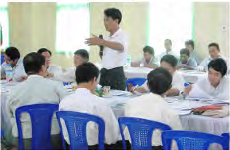
Discussion among relevant donors/NGOs seeking for synergies

In the meetings, participants shared and discussed about their experiences and strategies/approaches related to forestry and community development activities and seek for possible synergies among them. The Project will continue the meeting as gathering for information sharing and seeking further collaborations among relevant donors/NGOs for activities in the Reserved Forest area.