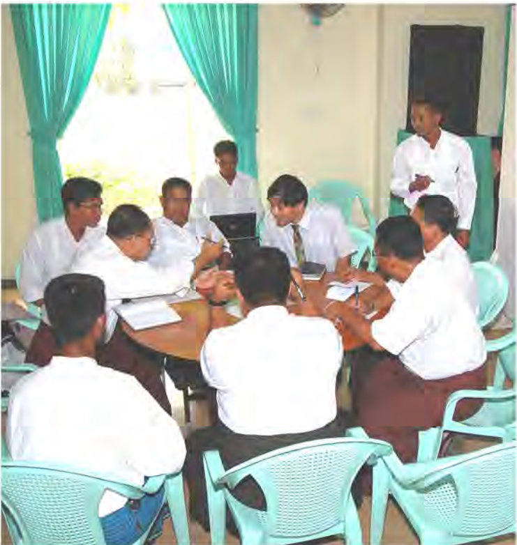
Group work in Mangrove Seminar