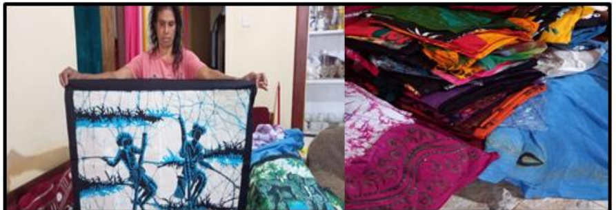
බතික් රෙදිපිළි නිර්මාණය කරන ස්වයං රැකියාවක්