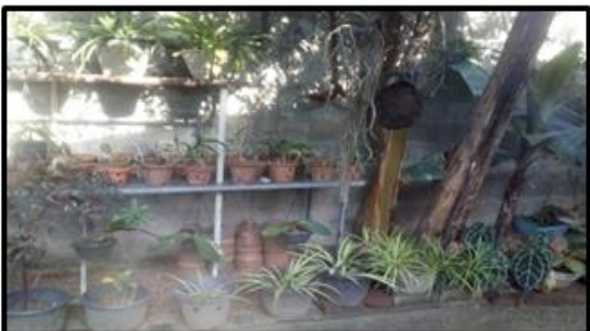
ස්වයං රැකියා පැළ තවානක්