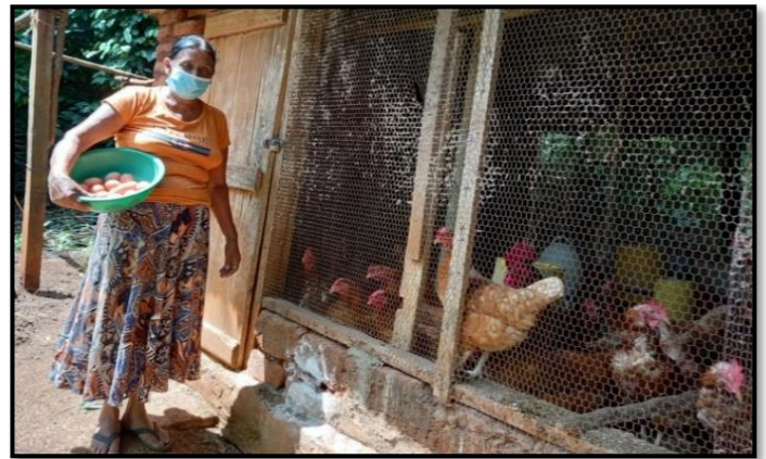
ස්වයං ව්‍යාපාර කුකුල් ගොවිපලක්