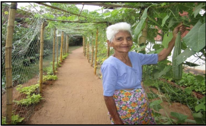
ස්වයං රැකියා ගෙවතු වගාවක්