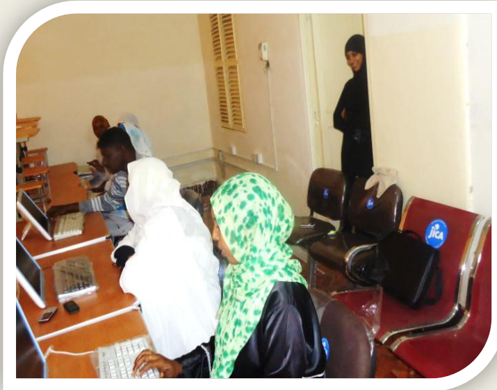
قاعدة بيانات الخدمة المدنية بولاية كسلا

وأتيحت الفرصة لتنفيذ هذا البرنامج عبر التنمية حيث تم ترتيب لقاءات مع مسئول الوكالة اليابانية للتنمية للتفكير وطرح المشروع وتم الاتفاق عليه ويستفيد من هذا البرنامج قرابة العشرين ألف موظف بهذه الولاية وتتقدم به الخدمة المدنية نحو المستقبل الأفضل