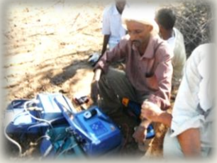
استكشاف المياه في شمال كسلا

تضمنت خطة المشروع في قطاع هيئة المياه لولاية كسلا عملية إستكشاف وتطوير موارد المياه الجوفية في شمال كسلا وقد تم القيام بالإستكشاف للمياه الجوفية بإعتماد تقنية المسح الجيوفيزيائي وذلك لتحديد المناطق المحتملة للمياه الجوفية وتركز العمل على المناطق التي تم اختيارها من قبل هيئة المياه لولاية كسلا وهذا بسبب المعاناه التي تواجهها من نقص حاد في المياه وهي مكلي وجمام ومنطقه دقين والهدف الرئيسي لهذا النشاط هو الكشف عن موارد المياه الجوفيه في المناطق المستهدفة ومن ثم تزويدها بالإمدادات الكافية من المياه.