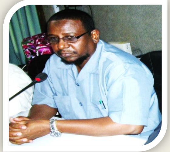
السيد/ محمد عثمان عباس وزير المالية والاقتصادية والقوى العاملة

إلا أنها تأثرت بتدفق عدد كبير من اللاجئين خلال فترة الحرب الأثيوبية قبل استقلال دولة اريتريا وايضا خلال الحرب الثانية بين الدولتين ( أثيوبيا وارتريا ) فضلاً عن العنف الداخلي بمنطقة شرق السودان الذي انتهى بتوقيع اتفاق سلام شرق السودان (ESPA) في أكتوبر 2006. وفي تلك الفترات تلقت ولاية كسلا الكثير من المعونات من المنظمات التي اتت لدعم وعون الولاية للخروج من الأزمات إلا أنني من خلال موقعي كوزير للمالية بولاية كسلا شهدت المفاوضات العميقة التي أجرتها الوكالة اليابانية للتعاون الدولي (جايجا) لاحتياجات كسلا العاجلة في خمس قطاعات والتي اتفقنا على تنفيذها معهم كمشروع. ويسرني إبابة عن حكومة ولاية كسلا ومواطنين الولاية أن أحيي جهود الحكومة اليابانية لإسهامها في تحسين الخدمات العامة للمواطنين بولاية كسلا والتحية لفريق جايجا العامل بالمشروع في ولاية كسلا. شكري اللامحدود مرة اخرى لحكومة اليابان وللوكالة اليابانية للتعاون الدولي ( جايجا ).