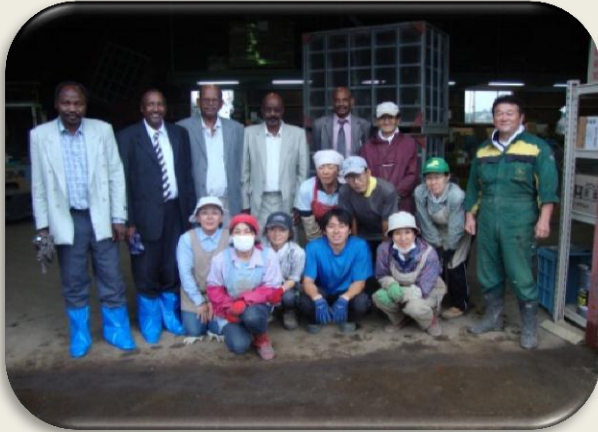
فريق وزارة الزراعة لولاية كسلا والخبراء اليابانيين

تعلمن الكثير من كورس التحسين المستمر الذي تم قيامه بدولة اليابان الكيزن يجعل العاملين يفكرو دائما ويقدمو المقترحات ولا بد من الإدراك بان دائما هناك مشاكل بالعمل ولاكن لا بد من حلها لتجد نفسك قد انجزت شيئا رائعا وان هذه الحيا زات قيمة بالنسبة لك