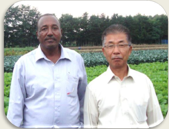
السيد/ عبد الحكيم مدير عام وزارة الزراعة والري

الزراعة وإنتاج كثير من المحاصيل الزراعية مثل الأرز ، البطاطس ، الفجل ، والمنتجات الحيوانية المختلفة. الخدمات الإرشادية تعتمد على الحكومات المحلية ولكن تنظيمات المزارعين والشركات لها دور أيضا في تقديم الخدمات الإرشادية لقاءنا في طوكيو بقيادةات الجايكا وسفير السودان في اليابان اضاف نكهة خاصة لزيارتنا التي استمرت أسبوعين وتفهمنا خلالها السياسات الزراعية والتنظيم الإرشادي.