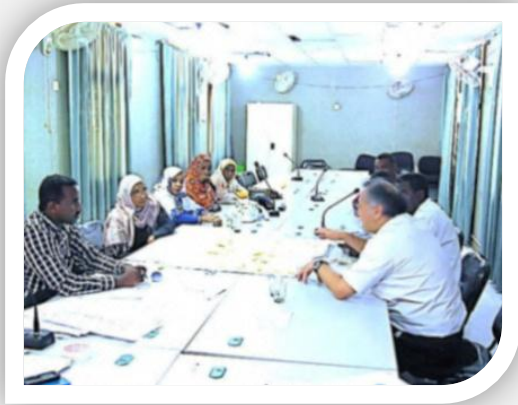
الكودباس في الإدارة العامة للتخطيط الإقتصادي والتنمية

منهج الكودوباس هو من اهم النشاطات التي نقوم بها حتى الان في إدارة التخطيط الإقتصادي والتنمية تحت رعاية مشروع نهضة كسلا حيث قام المشروع بعقد ورشة عمل لهذا البرنامج وكان اغلب المشاركين من وحدة المتابعة والتقييم اضافة لبقية الاقسام في الإدارة ولقد ابدا المشاركون عن مدا إرتياحهم تجاه هذه الورشة وبإذن الله في المرحلة المقبلة سوف يستخدم هذا المنهج في بقية الاقسام بصورة عامة.