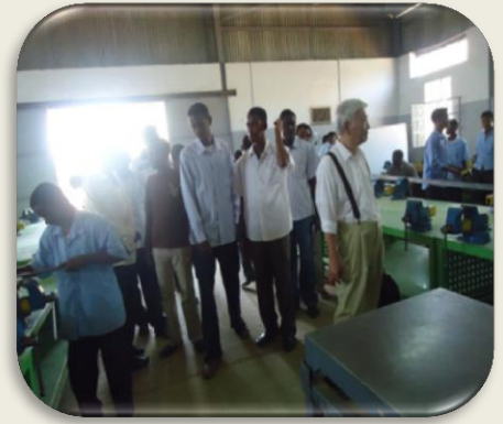
زيارة ميدانية لمراكز التدريب المهني في الخرطوم

يعتبر المسح واحد من اهم أنشطة المشروع في قطاع التدريب المهني كسلا . يهدف المسح الي تحديد كورسات التدريب حسب احتياج السوق ومتابعة خريجي مركز التديب لمعرفة مخرجات التدريب . يغطي المسح جميع