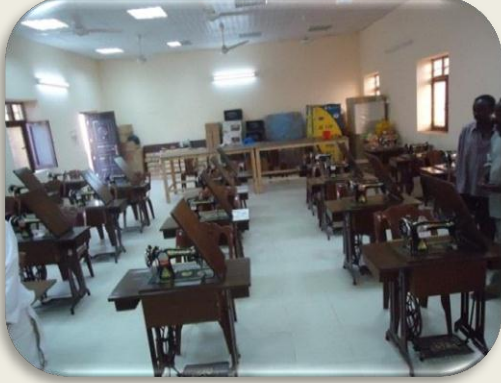
صالة تدريب ورفع القدرات وتحسين المهارات للمرأة