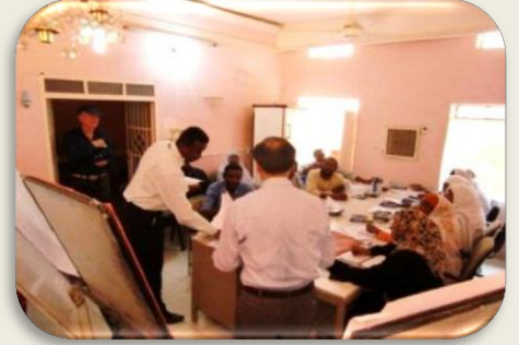
أساسيات الإدارة المالية في إدارة هيئة المياه بولاية كسلا

دورة أساسيات الإدارة المالية تعتبر من اهم الدورات التي تقوم بها منظمة جايكا ضمن خطة مشروع رفع القدرات وتحسين المهارات وتلبية الإحتياجات البشرية بولاية كسلا في هيئة المياه بولاية كسلا. والهدف من هذه الدورة مساعدة موظفي اقسام المحاسبة في الهيئة للحصول على مهارات