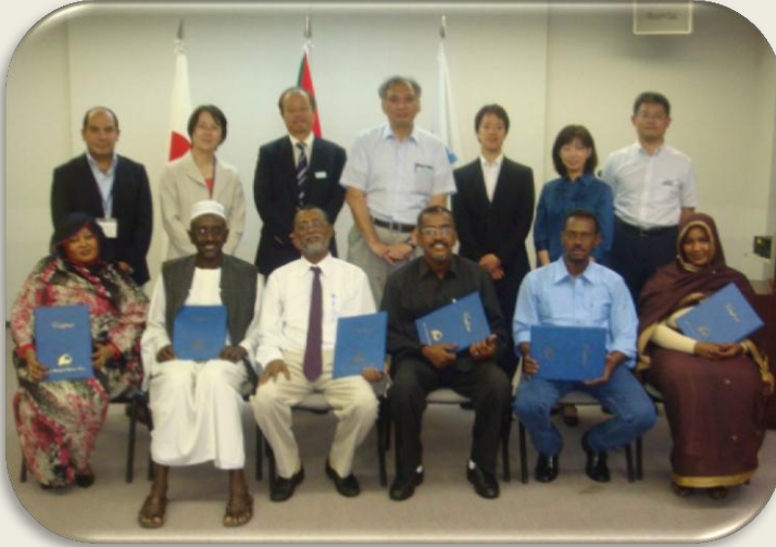
فريق وزارة المالية والإدارة العامة للتنمية والتخطيط الإقتصادي عقب انتهاء الدورة التدريبية لمنهج الكايزن في مكتب جايجا في مدينة أوساكا في اليابان