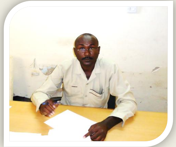
السيد/ عصام الدين عز الدين علي مدير عام ديوان الخدمة المدنية بولاية كسلا

ونياية عن العاملين بالخدمة المدنية بالولاية نتقدم بالشكر والعرفان لمسؤولي الوكالة اليابانية لما وجدناه.