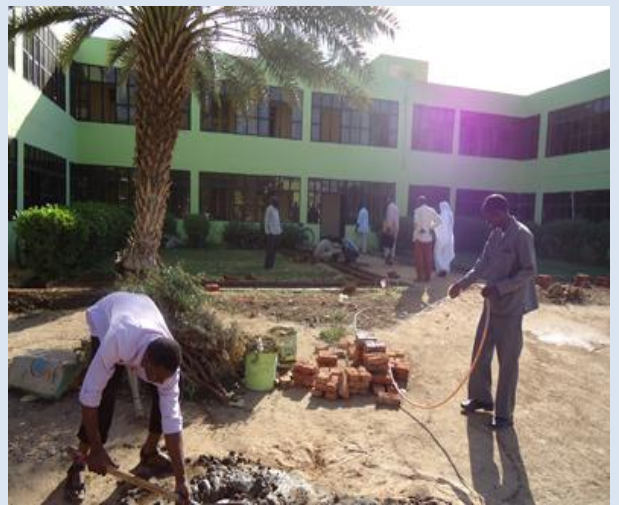
عضو من موظفي التنمية يقوم بتنفيذ الأفكار المقترحة