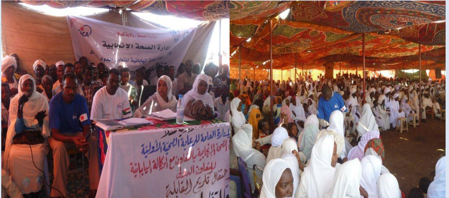
موظفي مشروع نهضة كسلا وقابلات ود الحليو اثناء السمنار