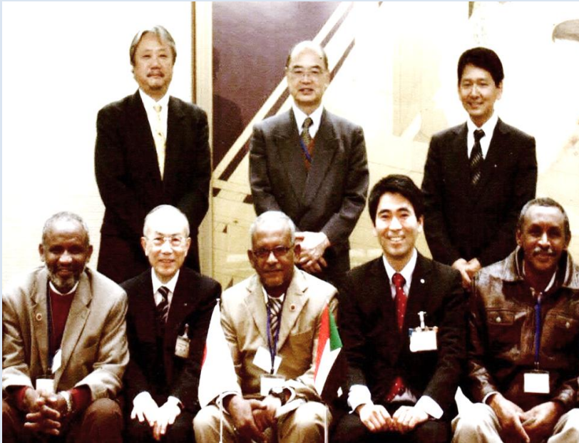
موظفي هيئة مياه الشرب وخبراء جايجا مع عمدة مدينة يوكوسوكا