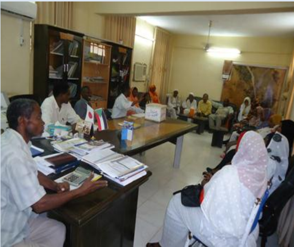
موظفي التنمية يناقشون خطة عمل الكيزن