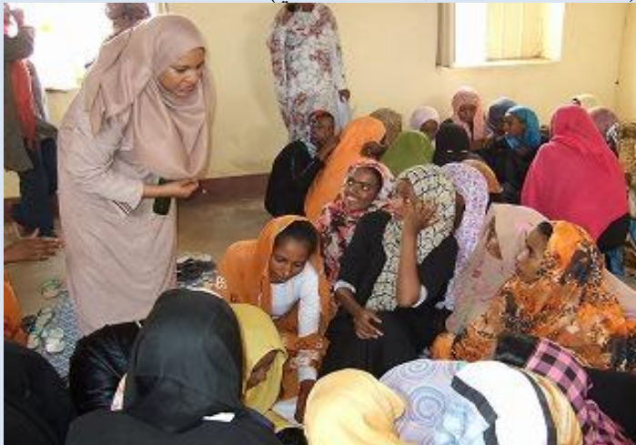
تكوين المجموعة النسائية