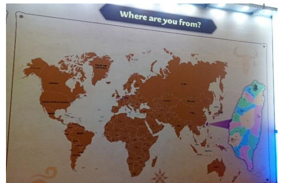
Bản đồ thế giới đánh dấu quốc gia có đại diện tham dự