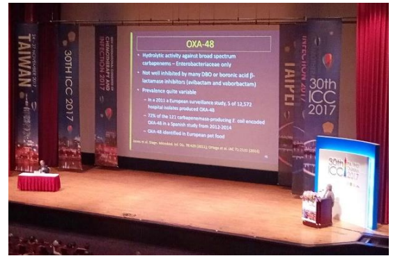
Hội trường chính của ICC2017

Nhiều thông tin mới hữu ích đã được cập nhật tại các phiên họp chung của Hiệp hội KSNK Châu Á Thái Bình Dương (APSIC) và Hội Vi sinh vật học Đài Loan. Hội nghị khoa học lần này có tất cả 93 bài phát biểu tại các phiên chuyên đề và hơn 1.200 bài thuyết trình bằng poster của đại diện từ khắp nơi trên thế giới. BS. Trang đã tham dự hội nghị với tư cách một diễn giả đến từ Việt Nam.