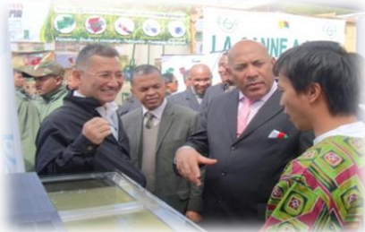
Le Premier Ministre Jean Omer BERIZIKY écoute les explications d'un expert du Projet lors de Fier MADA

Du 28 août au 1er septembre 2013 s'est déroulée à Mahajanga la première édition de la Semaine Culturelle de Mahajanga. Le projet a tenu un stand pendant 4 jours lors de cet évènement qui nous a permis d'accroître d'avantage notre visibilité. Nous avons ainsi pu sensibiliser le public sur les bienfaits de l'aquaculture du tilapia encore méconnus et avons pris contact avec des personnes intéressées par l'élevage du tilapia.