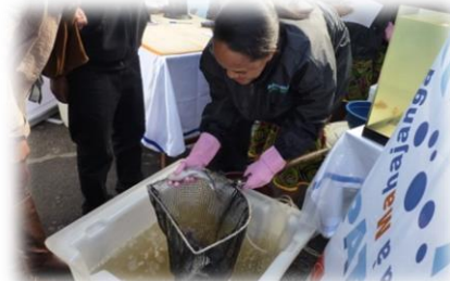
La Vente de tilapia a connu un grand succès lors de la journée d'ouverture de Fier MADA