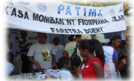
Des centaines de personnes ont visité notre stand lors de la semaine culturelle de Mahajanga