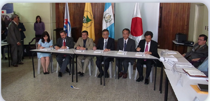
Firma de minuta por Representantes de SEGEPLAN, INFOM y JICA

En la 9ª. Reunión del Comité Conjunto de Coordinación -CCC- realizada el 27 de Febrero del 2013, se abordaron diferentes asuntos, tales como: Presentación del Informe de Avance Semestral No. 5 y presentación de Resultados de Evaluación Final Conjunta (JICA-Tokio e INFOM-UNEPAR), así mismo se presentaron y aprobaron los diferentes instrumentos metodológicos diseñados y aplicados durante la ejecución del Proyecto, para lograr el objetivo de: Mejorar la capacidad de las 3 oficinas Regionales de INFOM-UNEPAR (Oficinas de Huehuetenango, Central y Quetzaltenango) con el fin de apoyar a las Asociaciones/Comités de Agua responsables de la administración, operación y mantenimiento de las instalaciones de abastecimiento de aguas subterráneas. Así mismo, asistieron líderes