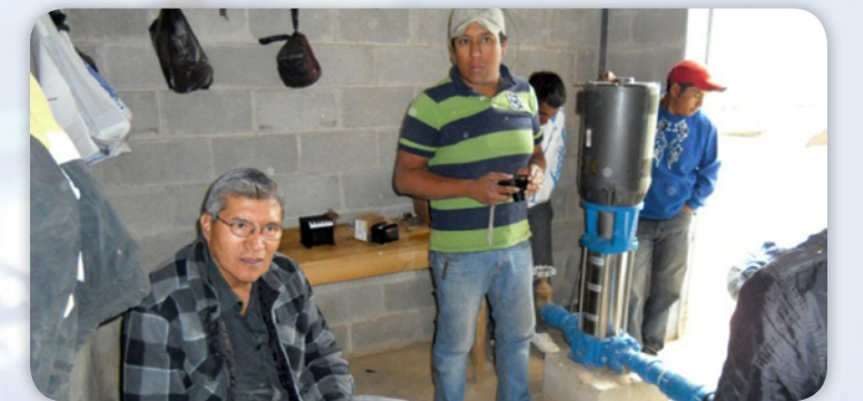
Instalación de Transformador y Amperímetro en la comunidad de El Sitio, Patzún Chimaltenango.

Finalizada ésta actividad se espera un mayor involucramiento de las Municipalidades al proceso de administración, operación y mantenimiento de las instalaciones de los sistemas de abastecimiento de agua con pozo mecánico, y realizar así un trabajo en conjunto entre las tres partes involucradas: Municipalidad, INFOM-UNEPAR y Asociaciones/Comités de Agua. Se espera además, que las comunidades estén conscientes de la importancia del cobro de una tarifa adecuada, que les permita ahorrar para que puedan solventar sus problemas técnicos con sus propios fondos económicos.