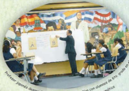
Profesor japonés desarrollando una clase demostrativa con alumnos de 6to. grado en el marco de la tercera capacitación regional de matemática