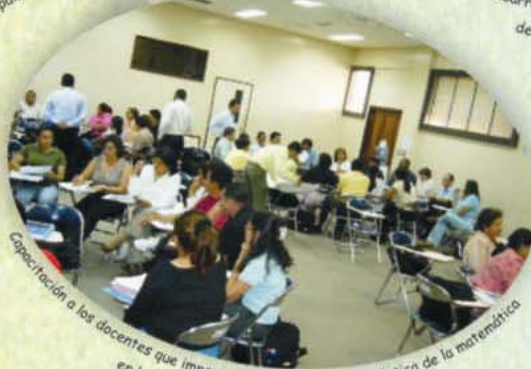
Capacitación a los docentes que imparten la asignatura de didáctica de la matemática en la formación inicial de docentes