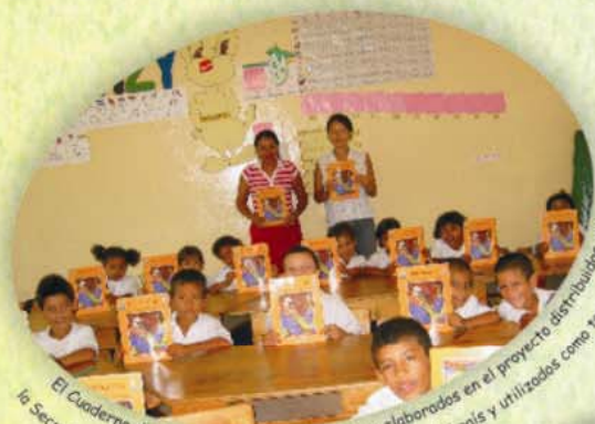
El Cuaderno de Trabajo y la Guía del Maestro elaborados en el proyecto distribuidos por la Secretaría de Educación a todos los centros educativos del país y utilizados como textos oficiales