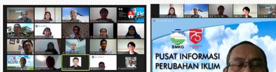
成果報告会の様子