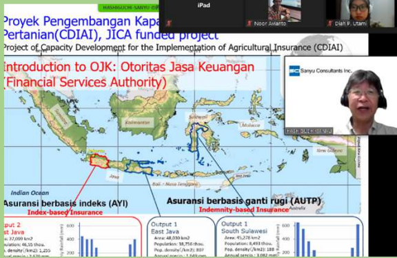
キックオフ会議の様子