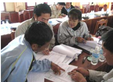
マニュアルを見つつフォーマット記入（サヤブリー県）

ODA カウンターパートファンドの運営監理では、たとえば上記の「2007/8 年度 PIP 予算」のうち、国内予算の約30%を占めるカウンターパートファンド（ODA のラオス国負担分）の管理手法の開発を目指します。他にも、セクタープログラム管理、郡レベルの PIP 運営監理手法の開発など、「 新たな手法への取り組み 」が PCAP2 の大きな特徴となっています。