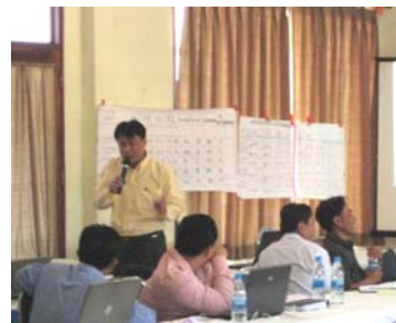
MPI パルーン講師のレクチャー（アタプー県）

第2フェーズでは2009年6月国会での法案成立を目指し、PIP 法整備に向けた様々な支援を実施しています。「 法体系に沿った形での各種ツールの提案 」、これも PCAP2 の特徴です。