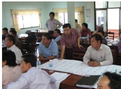
研修成果を見つつ真剣に講義を聞く（セコン県研修）

てはプロポーザルの質も向上しているとの報告を受けました。この研修は、約5500万キップ（うちDPI予算約2500万キップ、県予算3000万キップ）の独自予算で実施されたことから、今後自立発展的に郡レベルへPIP運営監理を普及する際のモデルケースとして注目に値するといえそうです。（平良）