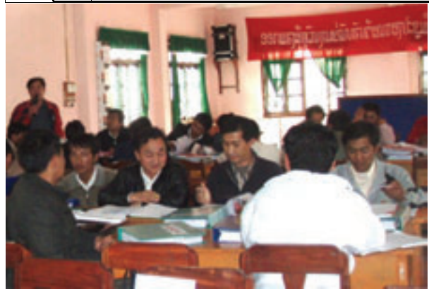
ສະພາບການຝຶກອົບຮົມທີ່ແຂວງຜົ້ງສາລີ

ບາດກ້າວຕໍ່ໄປຂອງ PCAP2 ກໍຄືການໃຫ້ຜູ້ທີ່ໄດ້ເຂົ້າຮ່ວມຝຶກອົບຮົມທັງໝົດ ໄດ້ນຳໃຊ້ຄວາມຮູ້ທີ່ໄດ້ມານັ້ນເຂົ້າໃນໜ້າວຽກຕົວຈິງຂອງຕົນ, ເຊັ່ນການຂຶ້ນແຜນເພື່ອດຳເນີນ PIP ແລະການຄາດຫວັງຜົນ, ຄືແຕ່ທ້າຍເດືອນ 2 ຫາ ເດືອນ 3 ຈະມີແຜນໃນການການຝຶກອົບຮົມກັບບ່ອນເຮັດວຽກ (OJT). ຜົນຂອງມັນຄາດວ່າຈະນຳມາໃຫ້ທ່ານໄດ້ຮັບຊາບໃນສະບັບໜ້າ. ຄິດວ່າຕ້ອງມີຂ່າວດີມາຕ້ອນທ່ານຢ່າງແນ່ນອນ. (ຜູ້ຂຽນ: ຮິລະໂຍຊີ)