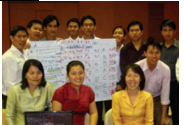
ການປະກາດຜົນການປະເມີນກິດຈະກຳ PIP / ຜູ້ເຂົ້າຮ່ວມຈາກກະຊວງ ຄຂປກ