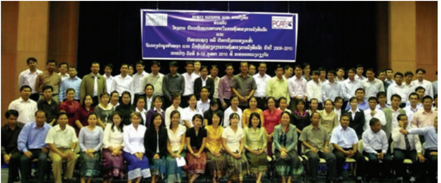
(ຮູບຖ່າຍ) ຄູຝຶກ MPI ແລະ ຜູ້ເຂົ້າຮ່ວມຈາກກະຊວງ ກົມ ແລະພະແນກທີ່ກ່ຽວຂ້ອງ

「ການຄຸ້ມຄອງ PIP」 ແມ່ນໄດ້ຖືກດຳເນີນມາແຕ່ເດືອນ 11 ປີ 2009 ຫາເດືອນ 1 ປີ 2010 ຊຶ່ງໃຊ້ເວລາທັງໝົດ 3 ເດືອນ, ກວມເອົາ 16 ແຂວງແລະນະຄອນຫຼວງວຽງຈັນ. ໃນນັ້ນ ຄູຝຶກແມ່ນມີທັງໝົດ 14 ທ່ານຊຶ່ງມາຈາກກົມປະເມີນ MPI ກົມຮ່ວມມືສາກົນ ກົມແຜນການ, ນອກຈາກນີ້ກໍມີຜູ້ປະສານງານໂຄງການການຝຶກອົບຮົມການຄຸ້ມຄອງ ຕະຫຼອດທັງພະນັກງານກົມຈັດຕັ້ງອີກຕື່ມຈຳນວນ 6 ທ່ານ. ເໝືອນດັ່ງທີ່ໄດ້ກ່າວໄວ້ໃນສະບັບກ່ອນໜ້ານີ້, ປີນີ້ພວກເຮົາຈະໄດ້ມີແຜນຂະຫຍາຍທົ່ວຂໍ້ໃນການຝຶກອົບຮົມໃຫ້ຫຼາກຫຼາຍແລະເລິກເຊິ່ງຂຶ້ນອີກ, ຄູຝຶກໄດ້ຖືກສ້າງມານັ້ນກໍມີຄວາມຊຳນານງານຂຶ້ນຫຼາຍ, ດັ່ງນັ້ນ ພວກເຮົາຈຶ່ງຄາດຫວັງວ່າ ການຝຶກອົບຮົມທັງໝົດນັ້ນ ຈະມີປະສິດຕິຜົນໃນການຄຸ້ມຄອງວຽກງານນີ້ໄດ້ເປັນຢ່າງດີ.