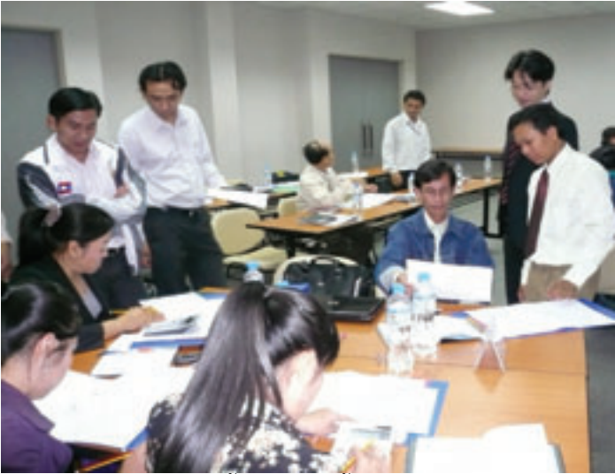
ການຝຶກອົບຮົມ: ການຄຸ້ມຄອງທາງດ້ານການເງິນການລົງທຶນລັດ

ໃນລະຫວ່າງກາງເດືອນ 1 ຜ່ານມາ, ໄດ້ມີການຈັດຝຶກອົບຮົມການຄຸ້ມຄອງການເງິນໃຫ້ກັບ DPI ຂອງທຸກໆແຂວງ. ຖືວ່າເປັນເທື່ອທຳອິດ ທີ່ຈັດຢູ່ພາຍໃຕ້ PCAP2, ຜູ້ເຂົ້າຮ່ວມມີຄວາມເຂົ້າໃຈໃນລະດັບສູງ ແຕ່ຍັງເປັນສິ່ງໜຶ່ງທີ່ລ້າງເລໃຈ ວ່າຈະເຮັດໄດ້ຫຼືບໍ່, ຫຼາຍໆທັດສະນະ ຍັງເປັນຫ່ວງວ່າໃນສັງຄົມລາວຍັງຄາບັນຫາຫຼາຍຢ່າງ.