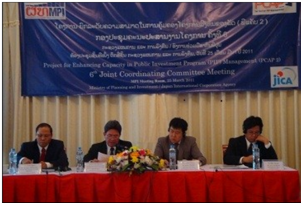
JCC会議オープニング（左から、MPIブンボン計画局長、ブンタビ副大臣、JICA戸川所長、奥村チーフアドバイザー）

第6回目となるJCC会議が開催されました。プロジェクト終了へ向けて、会場からは多くの有意義な意見が聞かれました。