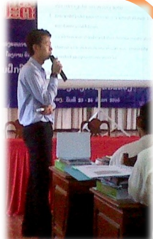
ເພາະສົມເຂົ້າໃນການຄວບຄຸມເບິ່ງແຍງ PIP ຂອງແຕ່ລະພະແນກການ.

ການເປີດການຝຶກອົບຮົມໃຫ້ແກ່ພະແນກແຜນການຂອງແຂວງ ແລະ ນະຄອນຫຼວງ ໃນເທື່ອນີ້ ສິ່ງທີ່ມີລັກສະນະພິເສດກ່ວາໝູ່ກໍ່ຄື ພະນັກງານທີ່ເປັນເອື້ອຍນ້ອງຍິງ ແລະ ໄວໜຸ່ມ ແມ່ນມີຄວາມຫ້າວຫັນເຂົ້າໃນການຝຶກອົບຮົມ. ບັນດາພະນັກງານທີ່ເປັນເອື້ອຍນ້ອງຍິງແມ່ນມີການຮຽນຮູ້ໄວ ຕັ້ງໃຈຟັງ ແລະ ຝຶກຝົນຢ່າງຕັ້ງໜ້າ. ບັນດາພະນັກງານໄວໜຸ່ມທັງຫຼາຍກໍ່ໄດ້ປະກອບສ່ວນຢ່າງມີຊີວິດຊີວາແລະມີບົດບາດສຳຄັນ ເຂົ້າໃນການຝຶກອົບຮົມຂັ້ນແຂວງ. ເພາະສະນັ້ນ ບໍ່ພຽງແຕ່ລະດັບຫົວໜ້າຂອງພເສ, ແຕ່ຍັງມີບັນດາພະນັກງານຫຼາຍລະດັບທີ່ມາເຂົ້າຮ່ວມໃນການຝຶກອົບຮົມ, ໂດຍພວກເຂົາເຈົ້າໄດ້ປະກອບສ່ວນຢ່າງຕັ້ງໜ້າ ແລະ ເພາະສົມເຂົ້າໃນການຄວບຄຸມເບິ່ງແຍງ PIP ຂອງແຕ່ລະພະແນກການ.