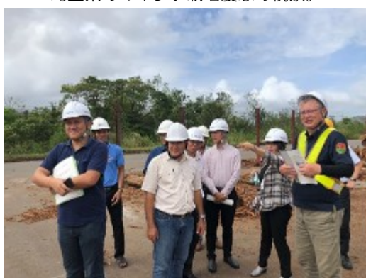
宮崎県・林産物流通センターの視察