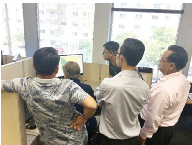
森林モニタリング研修の様子。

*1 REL(参照排出レベル):FREL/FRLとも呼ばれる、REDD+実施の成果を定量化するためのベンチマーク。