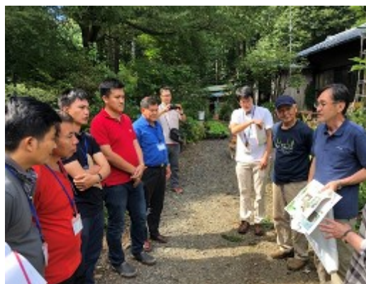
埼玉県のマイタケ栽培農家の視察。

ラオスからの参加者は、日本の山村が抱える課題がラオスの課題と類似していること、また、それらを乗り越えようとする地域の様々な努力や成果を見聞できたことから、自国の森林管理や地域振興に活用すべく、熱心に講義に耳を傾け、毎回、予定時間をオーバーするほど質問をするほど、真摯に研修に取り組んでいました。この研修の成果を、残りのプロジェクト期間の具体的な活動につなげていけるよう、側面支援したいと思います。