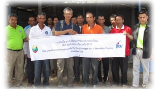
ພິທີມອບຮັບເມັດພັນເຂົ້າ ແລະ ປຸ້ຍ