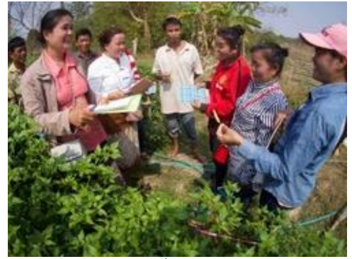
ການລົງສັງເກດເບິ່ງສ່ວນໝາກເຜັດປີ

ຜັກຊະນິດໃໝ່ໆທີ່ຊາວນາມີເຕັກນິກການປູກຊໍານິຊໍານານ