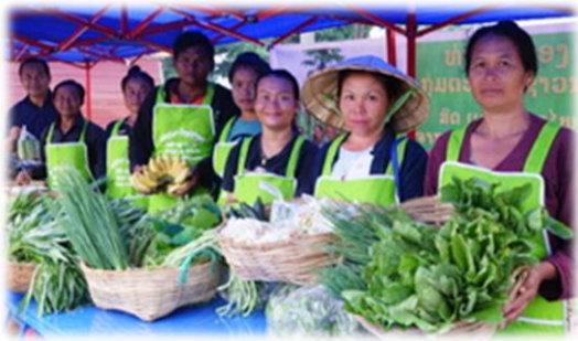
ຕະຫຼາດຊາວນາ ໂດຍກຸ່ມຊາວນາເຊສາລະລອງ

ໃນກິດຈະກຳດ້ານການຕະຫຼາດ, ເປົ້າໝາຍຂອງພວກເຮົາແມ່ນການປ່ຽນທັດສະນະ; ຈາກ”ປູກລ້າງ”ມາເປັນ”ປູກເພື່ອຂາຍໃຫ້ຕະຫຼາດ ແລະເລືອກປູກພືດທີ່ລົງທຶນໄປແລ້ວສາມາດຂາຍແລ້ວມີຜົນກຳໄລ” ດັ່ງນັ້ນ, ໂຄງການ Savan PAD ແມ່ນການຊ່ວຍເຫຼືອໃນດ້ານ: ①ແມ່ນເຂົ້າໃຈແນວໂນ້ມຂອງການຕະຫຼາດ, ②ການຄິດໄລ່ຜົນກຳໄລ-ຄ່າໃຊ້ຈ່າຍ ແລະ ວາງແຜນເພື່ອການຜະລິດ. ③ນອກຈາກນັ້ນ, ຍັງມີກິດຈະກຳສົ່ງເສີມຊ່ອງທາງການຂາຍໂດຍການສ້າງຄວາມເຂັ້ມແຂງເຄືອຂ່າຍລະຫວ່າງຊາວນາກັບພາກສ່ວນທຸລະກິດເອກກະຊົນ, ການນຳສະເໜີເຕັກນິກການຜະລິດ ຜັກຊະນິດໃໝ່ທີ່ຕະຫຼາດບໍ່ທັນຄຸ້ນເຄີຍ, ພ້ອມດຽວກັນນັ້ນ, ຜັກຊະນິດນັ້ນຕ້ອງຖືກກັບຄວາມຕ້ອງການຂອງຕະຫຼາດ. ໃນສະບັບນີ້, ພວກເຮົາຈະລາຍງານໃນກິດຈະກຳ ແລະ ໜາກຜົນທີ່ໄດ້ຮັບຂອງການຕະຫຼາດພາກສະໜາມ ສິກປີ 2018-2019.