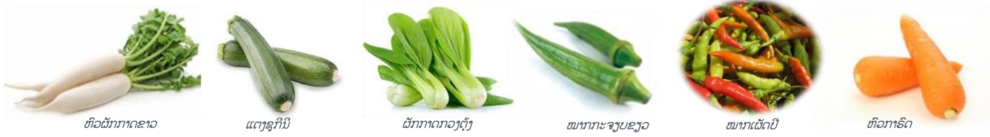
ຫົວຜັກກາດຂາວ ແຕງຊຸກິນີ ຜັກກາດກວງຕຸ້ງ ໝາກກະຈຽບຂຽວ ໝາກເຜັດປີ ຫົວກາຣິດ

ຜັກຊະນິດໃໝ່ໆທີ່ຊາວນາມີເຕັກນິກການປູກຊໍານິຊໍານານ