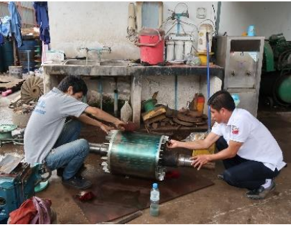
ການອະນາໄມຊັ້ນສວນມໍເຕີຈັກສູບນໍ້າ