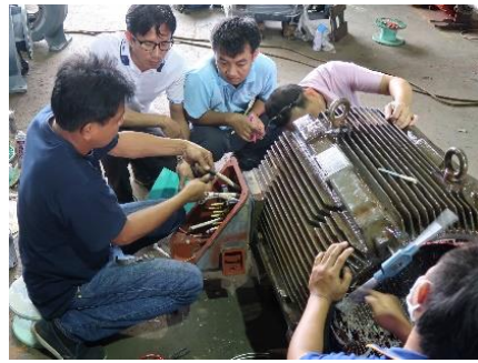
ກວດສອບຄວາມພ້ອມຂອງຈັກ