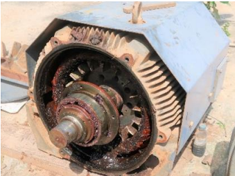
ມໍເຕີຈັກສູບນໍ້າ ກ່ອນການຍົກຍ້າຍ