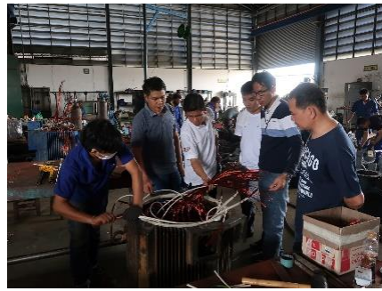
ຮັບຟັງຂັ້ນຕອນການຊັກນໍ້າໄຟຟ້າຫຼັງຈາກໃສ່ລວດທອງແດງ