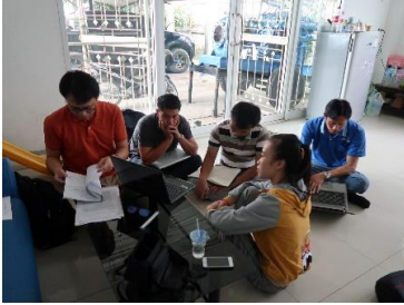
ທີບທວນຄືນບົດຮຽນໃນແຕ່ລະວັນ

ພວກເຮົາໄດ້ຮຽບຮຽງປຶ້ມຄູ່ມືການໃຊ້ງານຈາກຄວາມຮູ້ ແລະ ປະສົບການໃນການຝຶກອົບຮົມໃນຄັ້ງນີ້. ປຶ້ມເຫຼົ່ານີ້ປະກອບມີ 2 ພາກຄື: I. ເຕັກນິກທີ່ພະນັກງານ ຂຶ້ນເມືອງ/ແຂວງໜ່ວຍງານຊົນລະປະທານ ແລະ ກຸ່ມຜູ້ນຳໃຊ້ນ້ຳຈະຕ້ອງໄດ້ນຳໃຊ້. II. ຄວາມຮູ້ພື້ນຖານກ່ຽວກັບຈັກສູບນ້ຳທີ່ພະນັກງານຊົນລະປະທານຈຳເປັນຕ້ອງຮູ້.