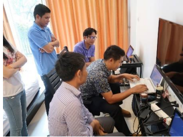
ຮຽນຮຽງປຶ້ມຄູ່ມືການນຳໃຊ້