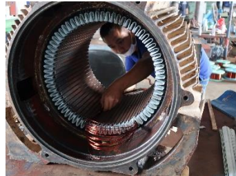
ການຄຽນທອງແດງໃນມໍເຕີ (ຂັ້ນຕອນລໍາຄົ້ນ)