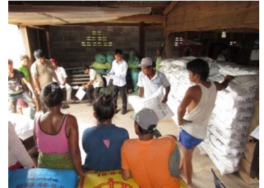
第 1 回研修後の種子、肥料の配付

この事業は、農家に優良種子と肥料を貸与する前に、研修により適切な技術の実践を促し生産性を高め、収穫した後に種子と肥料の代金を回収するというプログラムです。