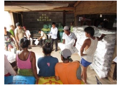
ແຈກຢາຍແນວພັນ ແລະ ປຸຍຫຼັງຈາກການຝຶກອົບຮົມຄັ້ງທີ 1

ໃນກິດຈະກຳນີ້, ນະໂຍບາຍກູ້ຢືມແນວພັນທີ່ມີຄຸນນະພາບ ແລະ ປຸຍ, ພວກເຮົາຈັດຝຶກອົບຮົມໃຫ້ຊາວນາໃນທຸກໆຄັ້ງທີ່ມີການແຈກຢາຍ ເພື່ອໃຫ້ຊາວນາໄດ້ປະຕິບັດຕາມຂັ້ນຕອນຢ່າງຖືກຕ້ອງເພື່ອໃຫ້ໄດ້ຮັບຜົນຜະລິດສູງ ຫຼັງຈາກເກັບກ່ຽວເຂົ້າແລ້ວ ເຮົາຈະໄດ້ເກັບຄ່າກູ້ຢືມຄືນມາເປັນເງິນ.