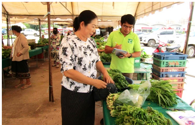
スタッフによる消費者へのインタビューの様子