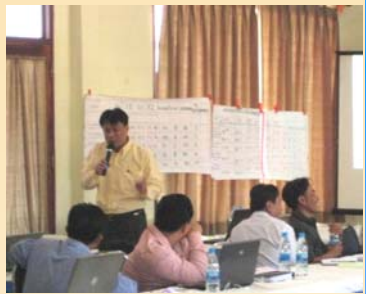
ການບັນລະຍາຍອຈ.ບັນລຸສິດ MPI (ທີ່ອັດຕະປື)

2 ການຊ່ວຍເຫຼືອໃນການສ້າງແລະປັບປຸງກົດໝາຍ PIP PIPແມ່ນການດຳເນີນການຕິດຕາມຄຸ້ມຄອງ ໂດຍອີງໃສ່ດຳລັດນາຍົກເລກທີ 58 (ປະກາດນຳໃຊ້ເດືອນມິຖຸນາ 2002). ແຕ່ອີງຕາມດຳລັດດັ່ງກ່າວແລະຂໍ້ ກຳນົດເລກທີ 918 ວ່າດ້ວຍຂອບເຂດການປະຕິບັດຈະມີສ່ວນໃດໜຶ່ງທີ່ຂັດກັບກົດໝາຍທີ່ກຳນົດພາລະບົດ ບາດຂອງແຕ່ລະກົມໃນກະຊວງແຜນການແລະການລົງທຶນ ແລະພະແນກແຜນການແລະການລົງທຶນ ເຊິ່ງ ເປັນອົງກອນທີ່ກ່ຽວຂ້ອງໃນການຕິດຕາມຄຸ້ມຄອງ PIP, ຈຶ່ງໄດ້ມີການຖືກຖຽງກ່ຽວກັບຄວາມຈຳເປັນທີ່ຈະ ຕ້ອງເຮັດໃຫ້ການຕິດຕາມຄຸ້ມຄອງ PIP ທີ່ນຳໃຊ້ ODA ແລະທີ່ ນຳໃຊ້ງົບປະມານພາຍໃນໃຫ້ເປັນອັນ ໜຶ່ງອັນດຽວ, ດ້ວຍເຫດນີ້ ຈຶ່ງໄດ້ມີການສະໜັບສະໜູນດຳລັດດັ່ງກ່າວໃຫ້ກາຍ ເປັນກົດໝາຍ. ໃນໄລຍະ 2 ນີ້ ໄດ້ມີການຊ່ວຍເຫຼືອຫຼາຍຢ່າງ ເພື່ອແນ່ໃສ່ການຮັບຮອງຮ່າງກົດໝາຍ PIP ໃນການປະຊຸມສະພາໃນເດືອນມິຖຸນາ 2009. “ການນຳສະເໜີເຄື່ອງມືຕິດຕາມຄຸ້ມຄອງທີ່ອີງໃສ່ແມ່ບົດກົດໝາຍ” , ເຊິ່ງແມ່ນຈຸດພິເສດຂອງPCA2.