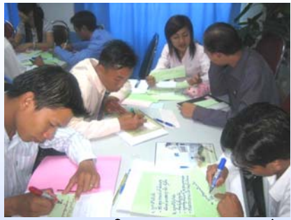
ຮູບ:ການປະຊຸມພາຍໃນເວລາລົງເຮັດ ຂ.ອຸດົມໄຊ.

ໃນຂັ້ນຕອນການເບີກຈ່າຍຈະມີ ຜູ້ຮັບເໝົາ ກໍ່ສ້າງ, ເຈົ້າຂອງໂຄງການ, ພະແນກ ແຜນການແລະການລົງທຶນ, ພະແນກເງິນແລະ ອື່ນໆເຊິ່ງມັນຕ້ອງກ່ຽວຂ້ອງກັບຫຼາຍ ພາກສ່ວນ. ນອກນີ້ ພວກເຮົາໄດ້ລົງເກັບກຳຂໍ້ ມູນຢູ່ຫຼາຍແຂວງ ເຊິ່ງແຕ່ລະແຂວງກໍມີສະ ພາບທີ່ແຕກຕ່າງກັນຫຼາຍ, ຈຶ່ງເຮັດໃຫ້ເສຍເວ ລາໃນການເກັບກຳຂໍ້ມູນຫຼາຍ. ລຸ່ມນີ້ແມ່ນສິ່ງທີ່ ເກັບກຳມາ. ● ໄລຍະເວລາໃນການເບີກຈ່າຍ ໃຫ້ຜູ້ຮັບເໝົາກໍ່ສ້າງຈະກຳນົດດ້ວຍປະລິມານ