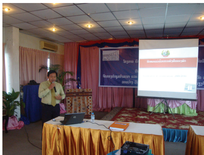
プーコン氏からのPIP法に関するプレゼンテーション

今後、微修正された後60日以内に国会議長のサインを経て、大統領令のもとで正式発効となります。そ