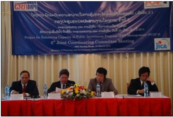
ກອງປະຊຸມຄະນະປະສານງານໂຄງການ (JCC) ຄັ້ງທີ 6 ລະຫວ່າງ ກະຊວງແຜນການ ແລະ ການລົງທຶນ ກັບ ອົງການຮ່ວມມືສາກົນຍີ່ປຸ່ນ

ກອງປະຊຸມ JCC ຄັ້ງທີ 6 ໄດ້ໄຂຂຶ້ນ. ຈົນກ່ວາໂຄງການຈະສິ້ນສຸດລົງ ພວກເຮົາໄດ້ຮັບຮູ້ຄວາມຄິດເຫັນທີ່ເປັນປະໂຫຍດຫຼາຍຫຼາຍຢ່າງຈາກສະຖານທີ່ຈັດກອງປະຊຸມ