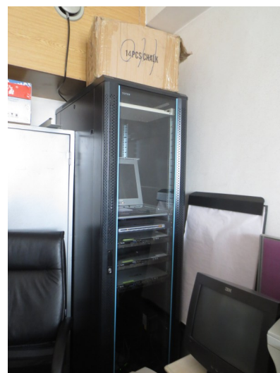
Зураг 3: ГХОЗБГ-ын шинэ сервер.

Статистик мэдээлэл, өгөгдөл солилцох ажлыг гүйцэтгэх хүрээнд хэд хэдэн агентлаг газруудтай гэрээ байгуулсан ба