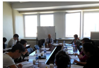
Зураг 3: ГХОЗБГ семинар

Семинарын хүрээнд Профессор Үэно ГШХО-ыг дэмжих бодлогын үндсэн асуудлууд, төр хувийн хэвшил, НЦҮ-ний үүрэг зэрэг асуудлуудыг жишээ саналд тулгуурлан авч үзсэн. Семинарын эхний хэсэг ГХОЗБГ хуучин ГХОГ-ын НЦҮ-ний үндсэн үүргийн талаар авч хэлэлцсэн. Мөн