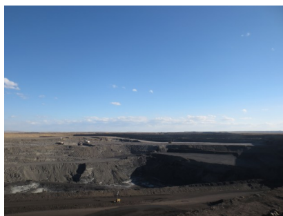
Зураг 2: Таван Толгой уурхай

дотоодын компани болон ЖДҮ-ийг хэрхэн хөгжүүлж болох талаар орон нутгийн холбогдох албаны хүмүүс болон уул уурхайн томоохон кампанитай уулзаж санал