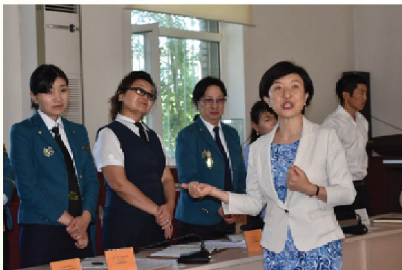
Үйлчлүүлэгчтэй харилцах, үйлчилгээний чанарыг сайжруулах чиглэлийн богино хугацааны Япон мэргэжилтэн багшийн сургалт зохион байгуулах.

Нийгмийн даатгалын үйл ажиллагааг сайжруулахын зэрэгцээ, тав тухтай найрсаг үйлчилгээ үзүүлж, сэтгэл ханамжийг дээшлүүлснээр даатгуулагч, тэтгэвэр авагчдын сэтгэлд хүрсэн чадварлаг найрсаг хамт олныг бүрдүүлж, ажлын үр өгөөжийг нэмэгдүүлнэ.