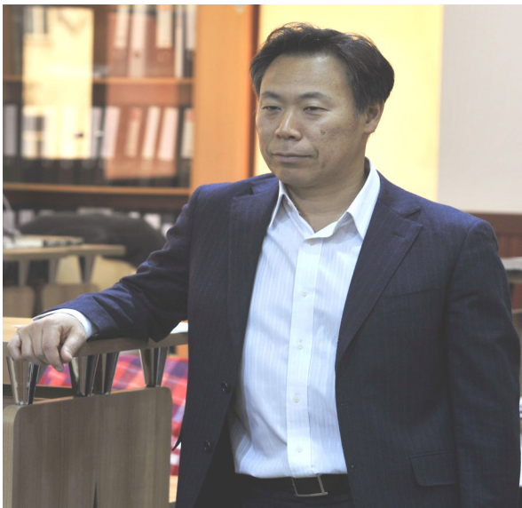
千葉チーフアドバイザー

国連ESCAPの一つの役割は、加盟国の障害情報を収集し発信することです。2001年当時、すでにウェブサイトが利用されてました。しかし障害者が利用しやすいウェブサイトではなかったのです。例えば、音声呼び上げソフトを使っても入手できない情報があったり、画像や写真に代替テキストがなかったり、またコントラストが悪く文字が見えづらかったり、今で言うウェブアクセシビリティが完備されてなかったのです。そこで私の最初の仕事は、ESCAPのウェブサイトをアクセシブルにすることでした。ただ全体をアクセシブルにするのは当時難しく、まずは社会開発部の障害情報ウェブサイトからアクセ