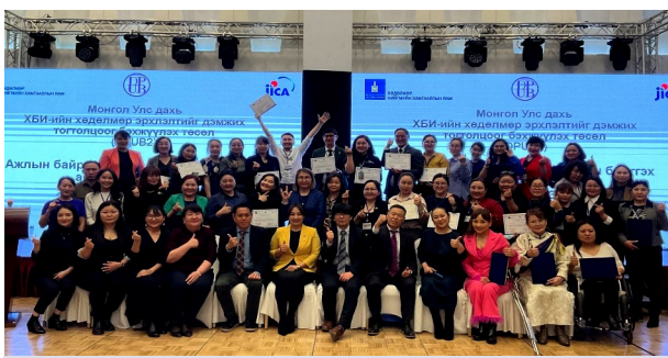
修了証授与後の記念撮影

トレーナーからは障害者就労やジョブコーチの活動に関する多くの質問が寄せられました。事前準備を終えた8名のジョブコーチトレーナーは、主に各自が専門とするテーマで講義を行いました。研修ではジョブコーチに必要なスキルを磨くためのロールプレイを交えた演習も行われ、参加者からは大変好評でした。研修には民間企業、政府、NGO、職業紹介所などから計35名が参加し、最終日に修了証が授与されました。DPUB2は8名のトレーナー及び本研修の修了生が、ジョブコーチのロールモデルとなることを願っています。